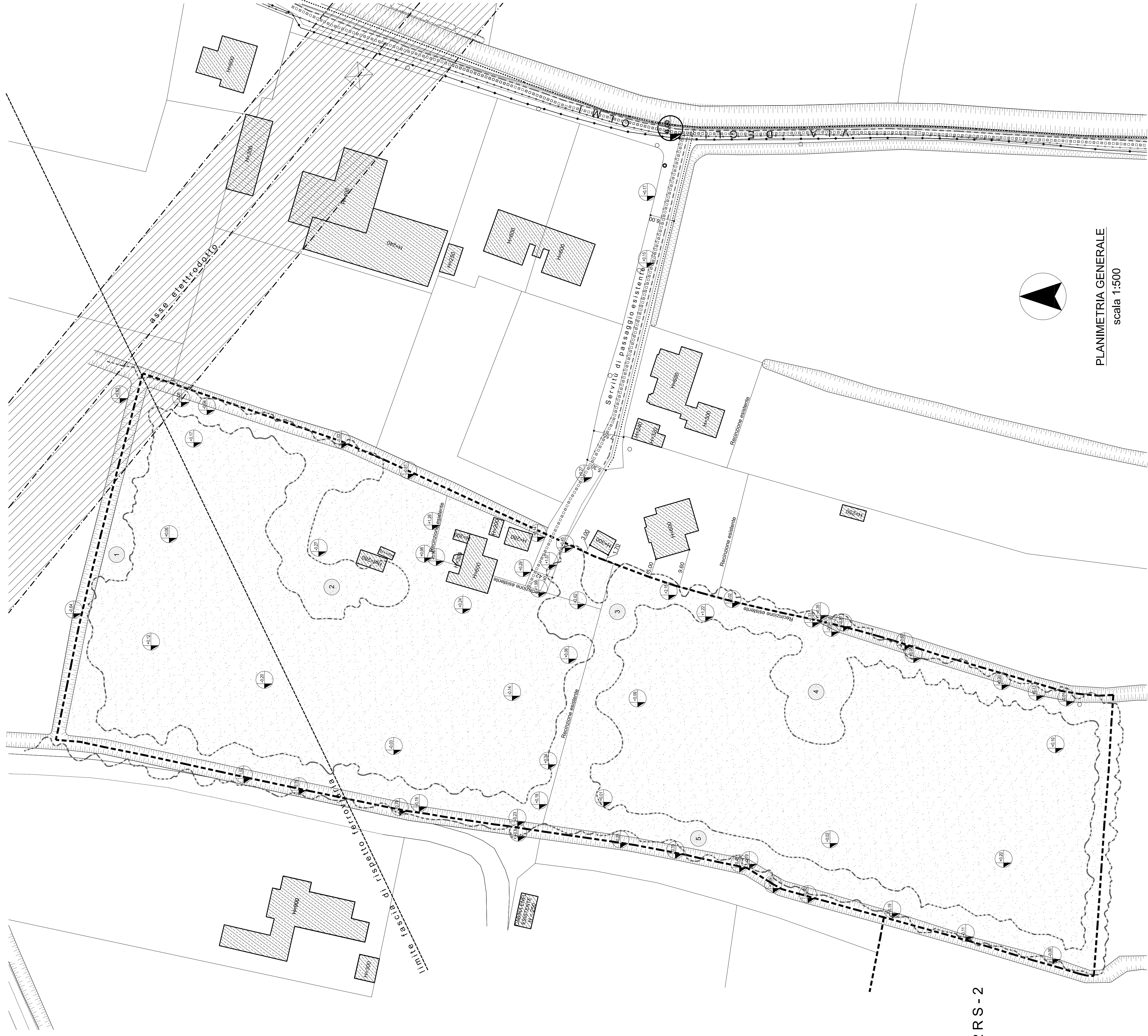
PLANIMETRIA GENERALE scala 1:500