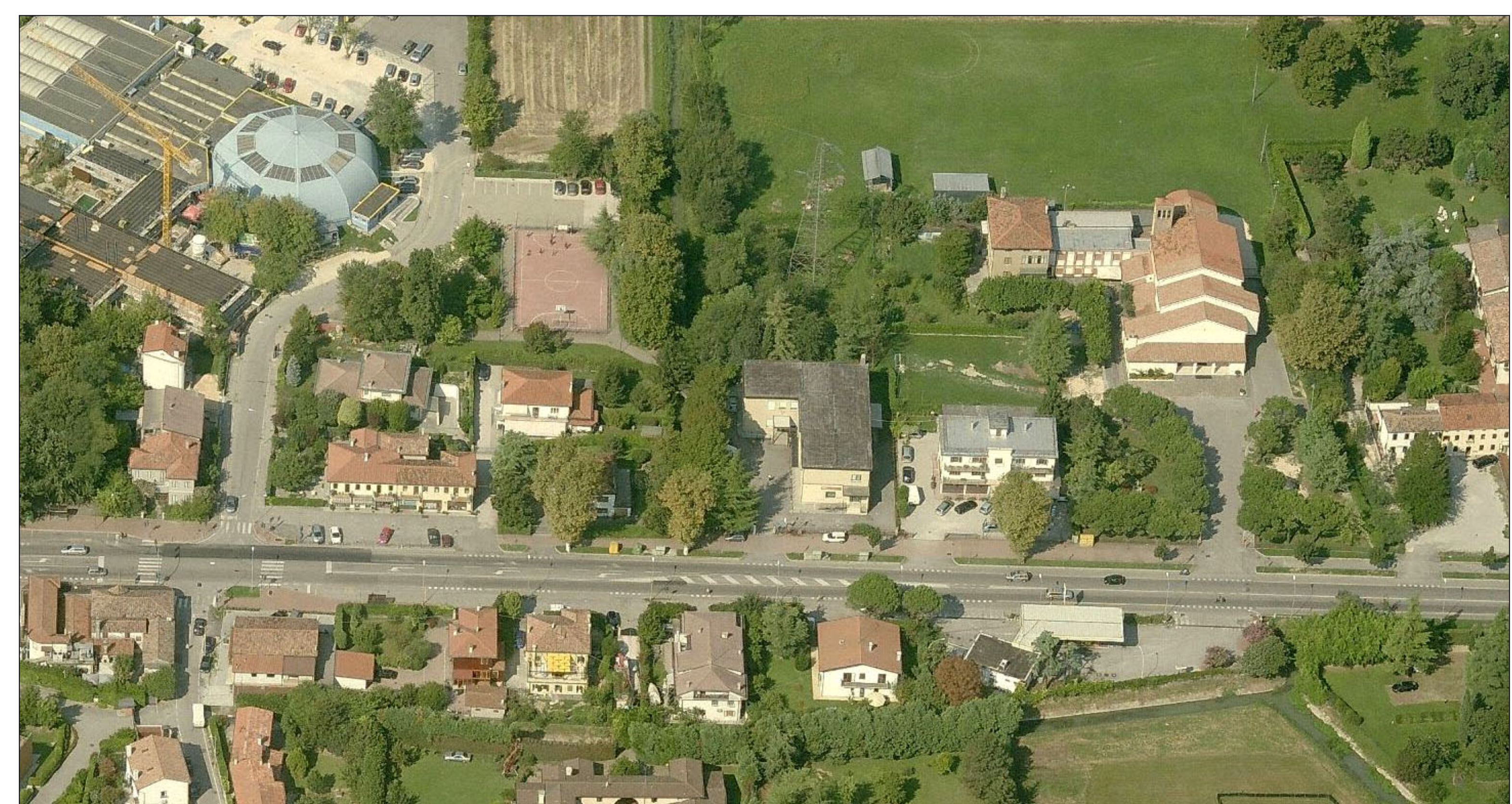
Vista aerea Terraglio dettaglio da EST