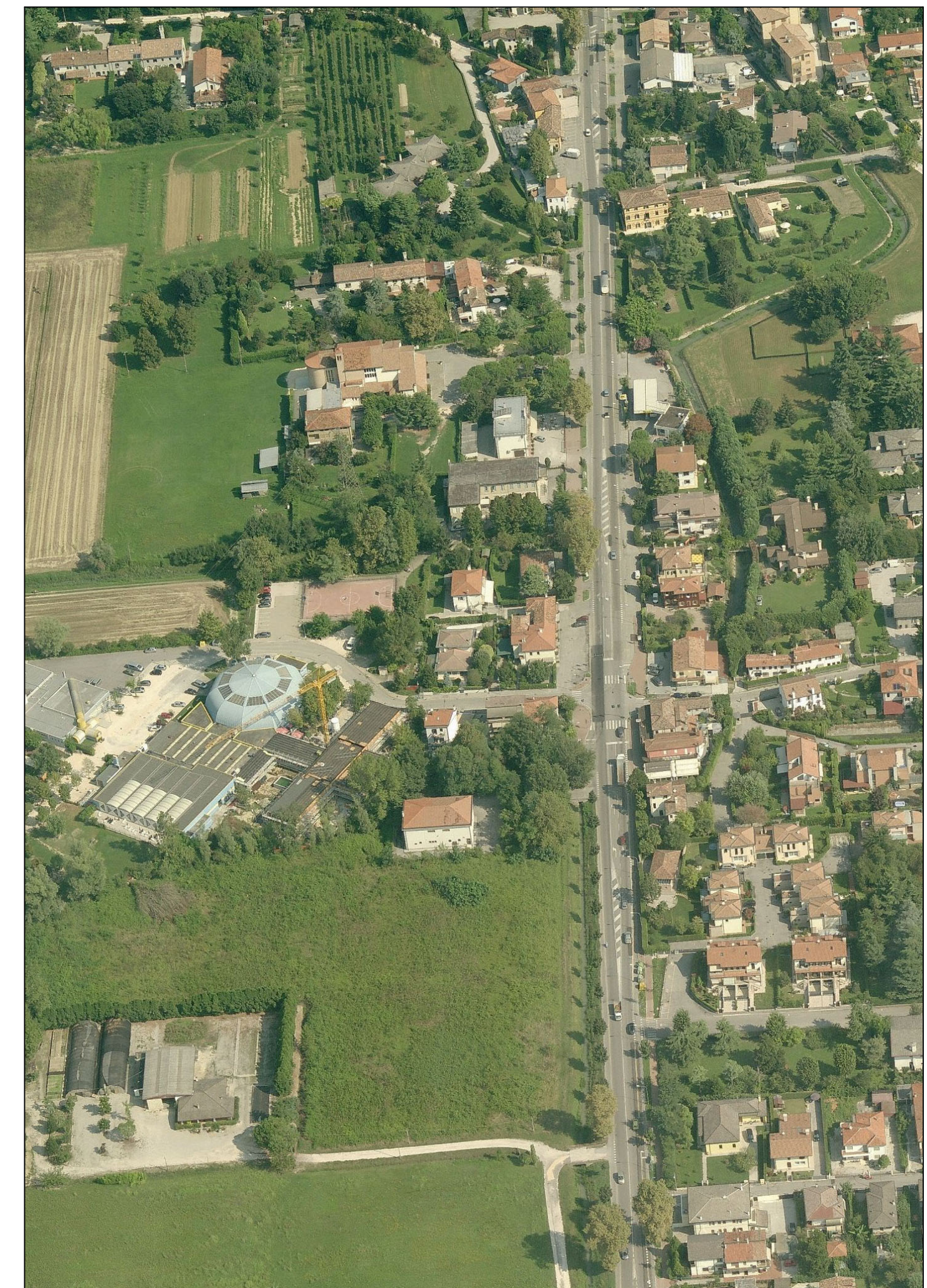
Vista aerea Terraglio da SUD