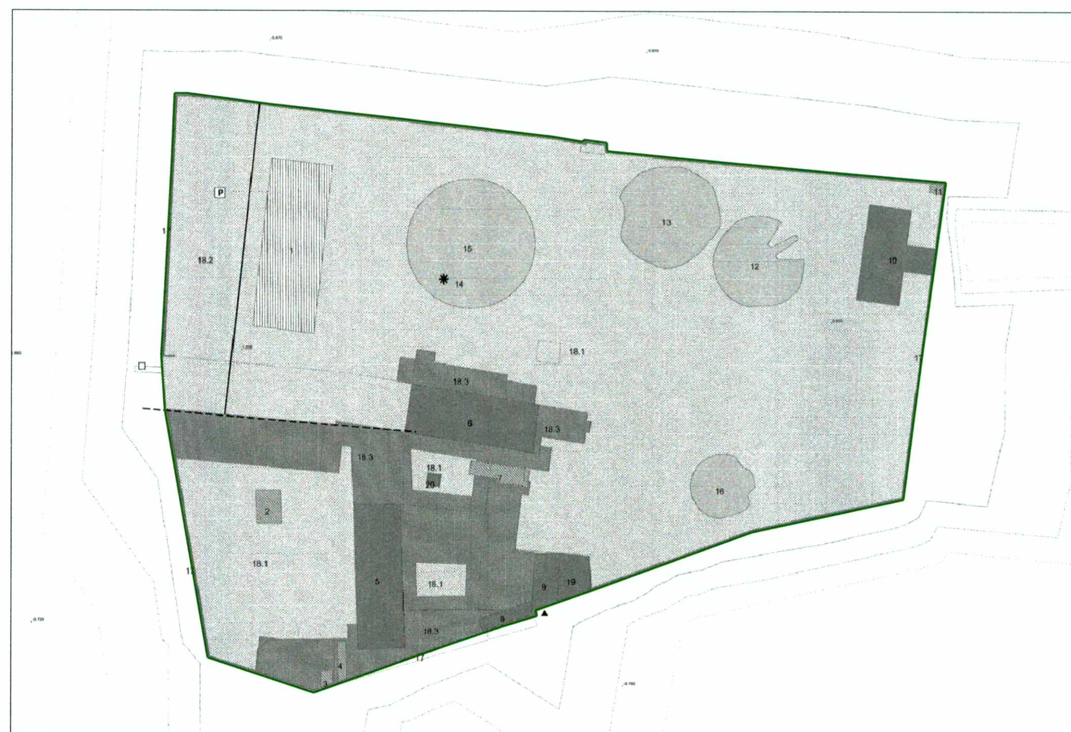
PERIMETRO AMBITO DI INTERVENTO IN ATTUAZIONE DELLA V.P.R.G. - Scheda 28 Estensione isola 25320 mq Perimetro 617 m