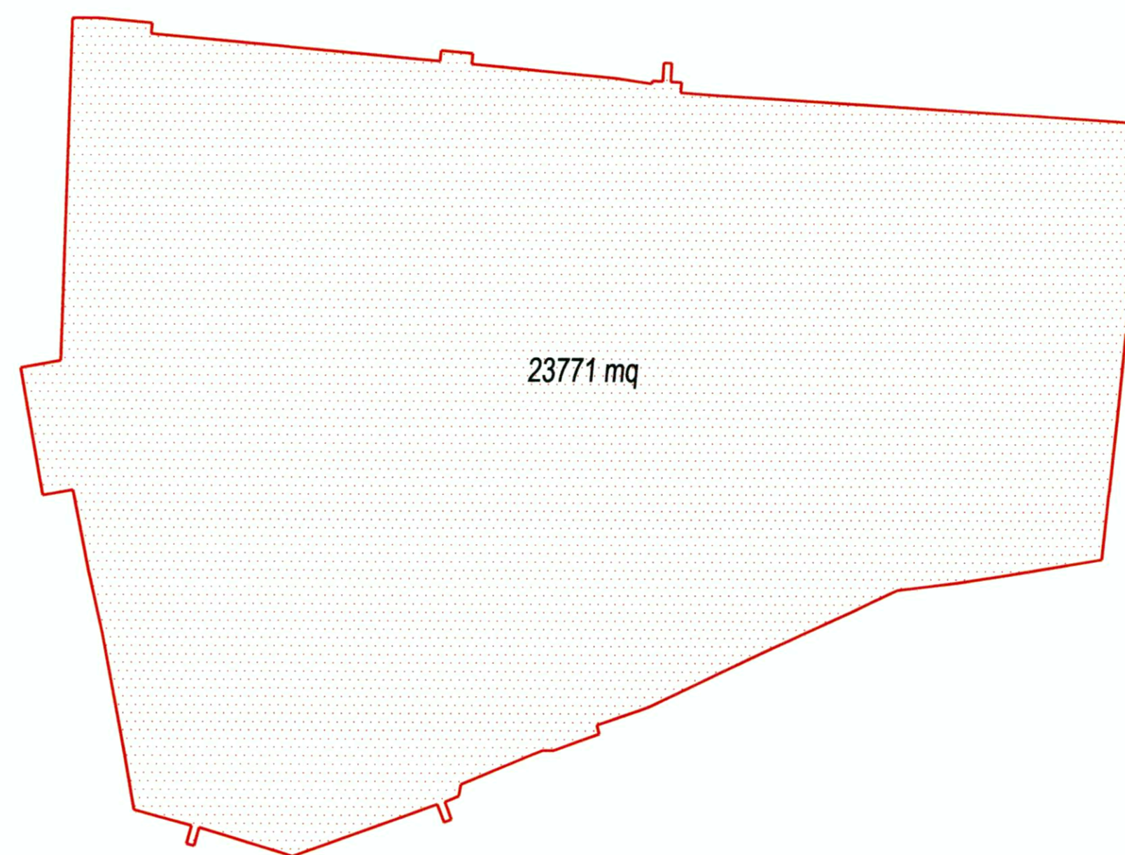
PERIMETRO PIANO DI RECUPERO MODIFICATO DI PROGETTO Superficie: 23771 mq Perimetro: 684 m