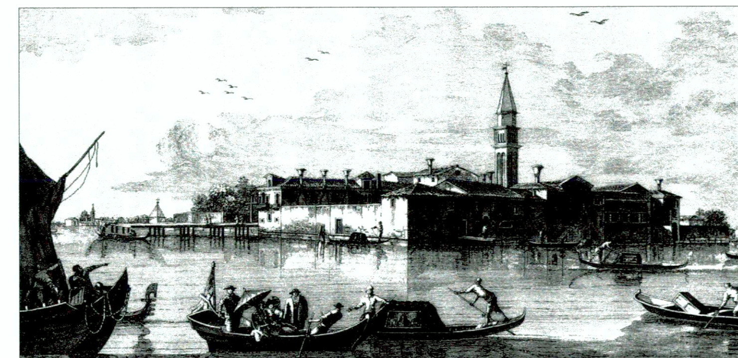
TIRONI - SANDI, "XXIV Isole della Laguna", T. VIERO, Venezia, 1779.