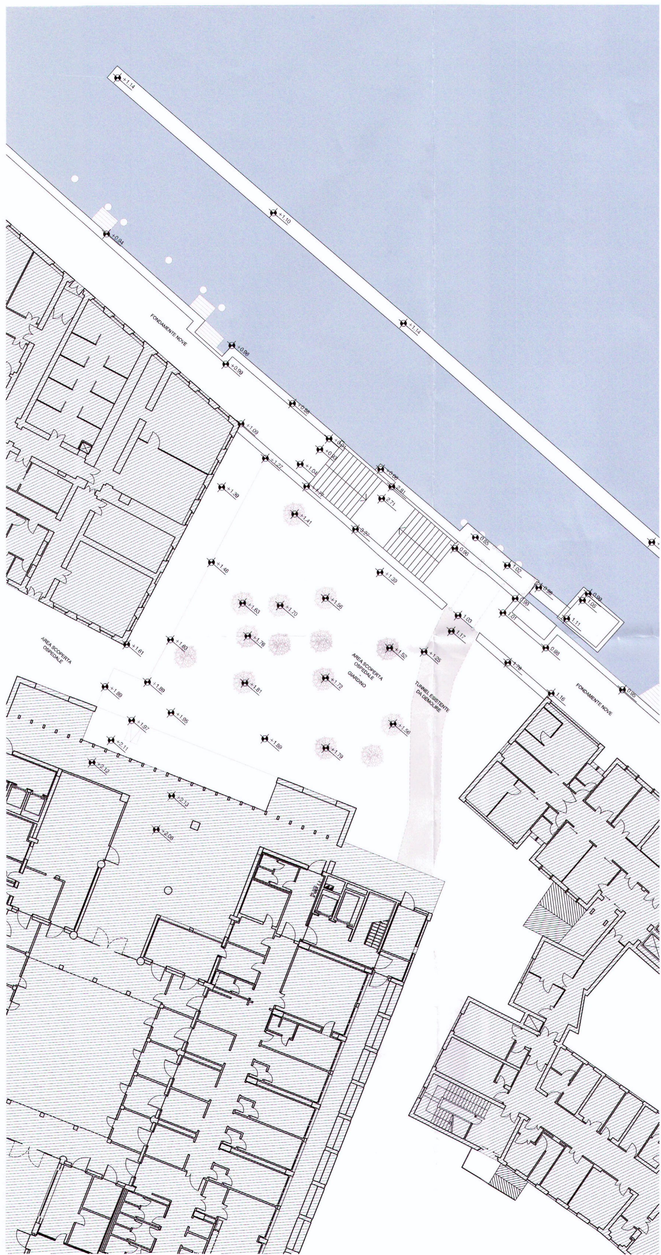
PLANIMETRIA GENERALE STATO DI FATTO - RILIEVO PLANOALTIMETRICO_scala 1:200