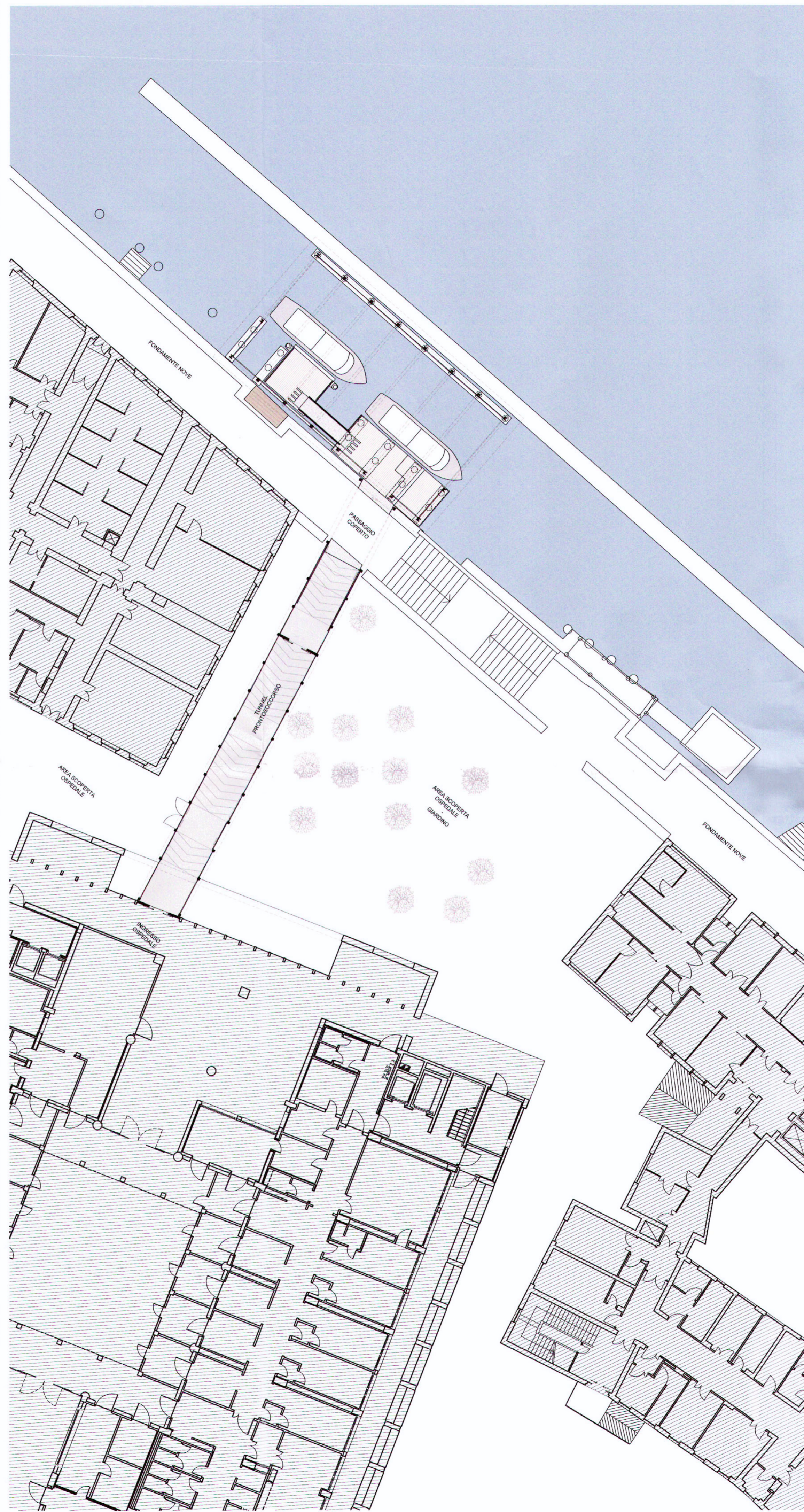
PLANIMETRIA GENERALE DI PROGETTO_scala 1:200