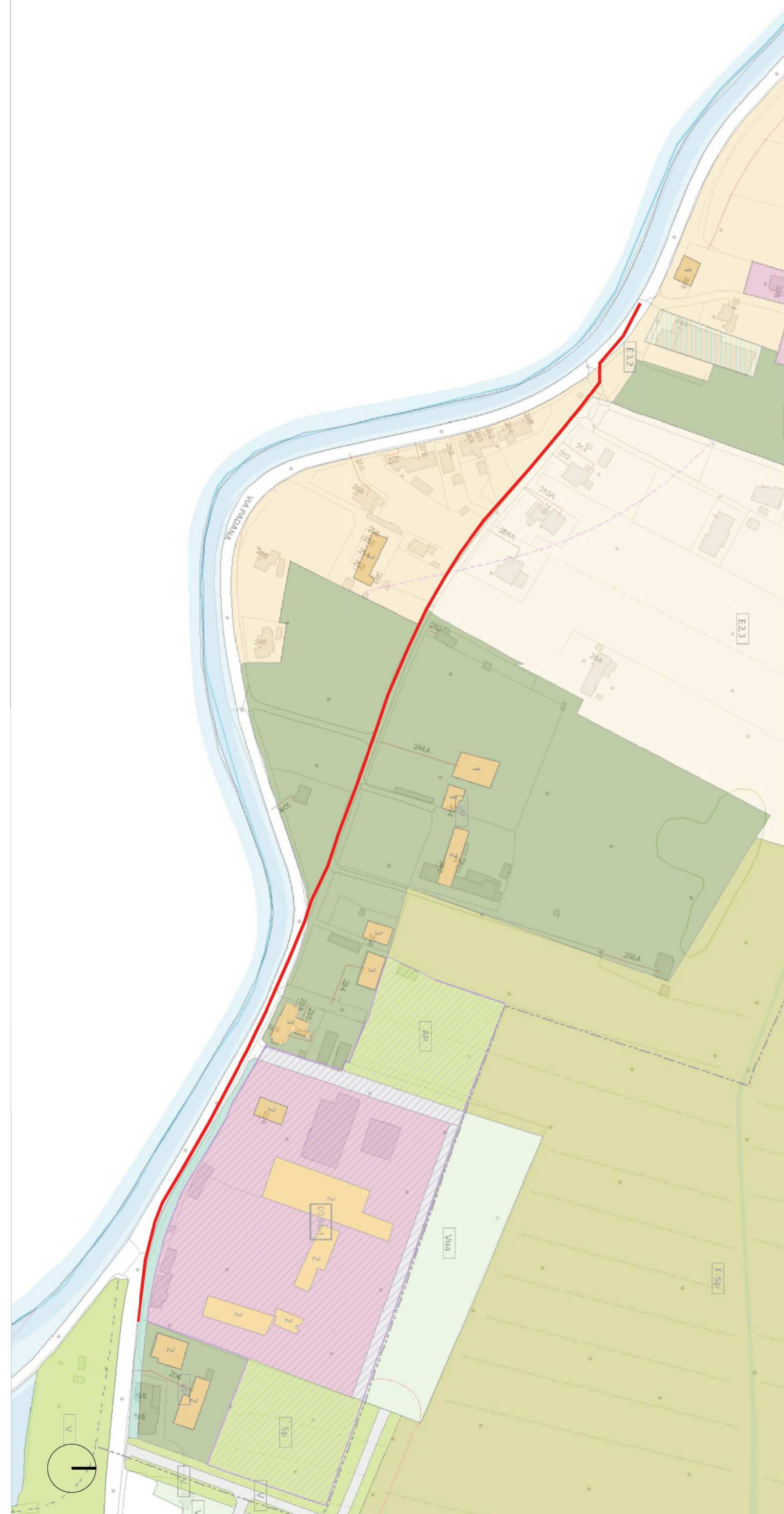
Inquadramento urbanistico scala 1:2000