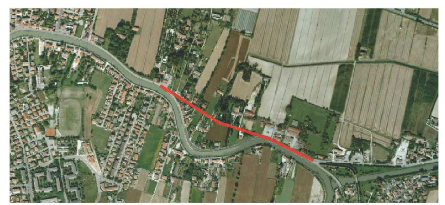
Planimetria stato di fatto