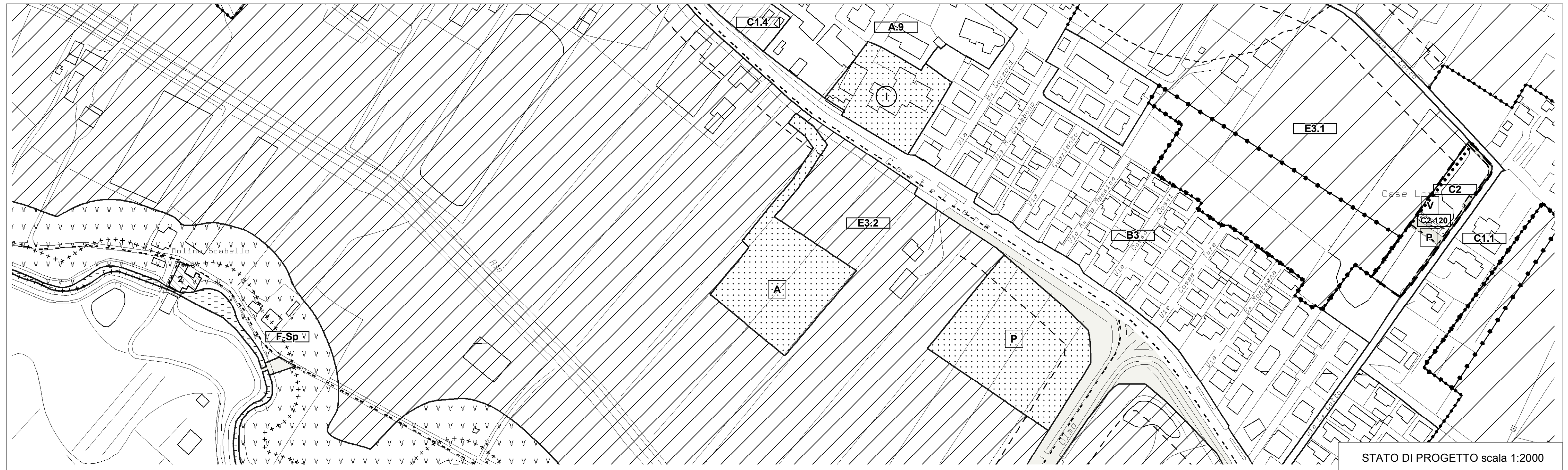
STATO DI PROGETTO scala 1:2000