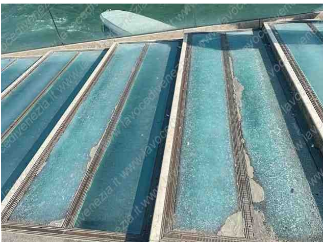
Fig. 7 – elementi danneggiati 2