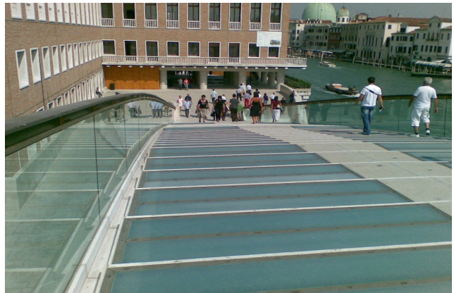
Fig. 4 - vista lato stazione 2