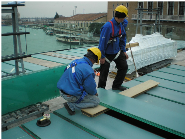
Fig. 5 – dettagli costruttivi