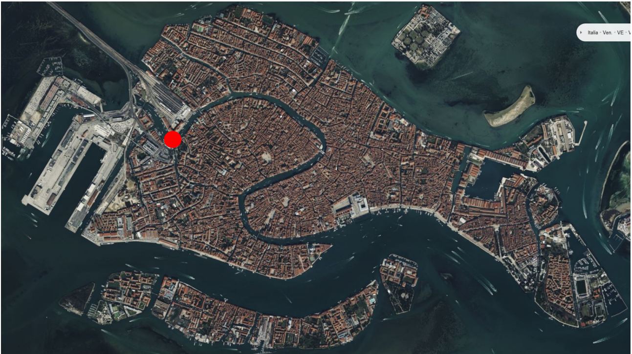
Fig. 1 - Venezia insulare

Gli interventi da progettare interessano il ponte della Costituzione, sito a Ovest del centro storico della città di Venezia, tra il sestriere di Cannaregio e Ple Roma.