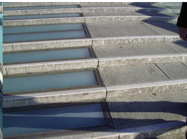
Fig. 8 – elementi danneggiati 3