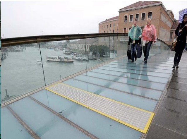
Fig. 6 – elementi danneggiati 1