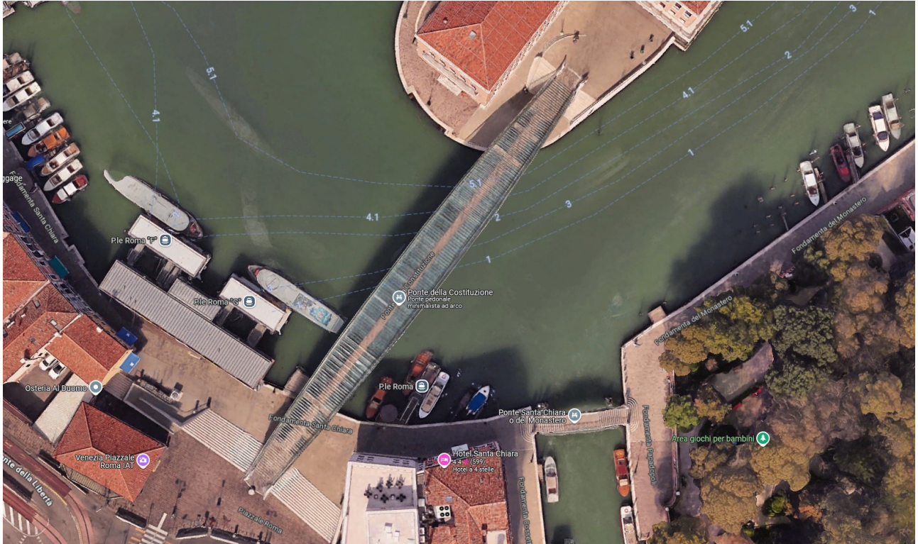
Fig. 2 - Area oggetto d'intervento