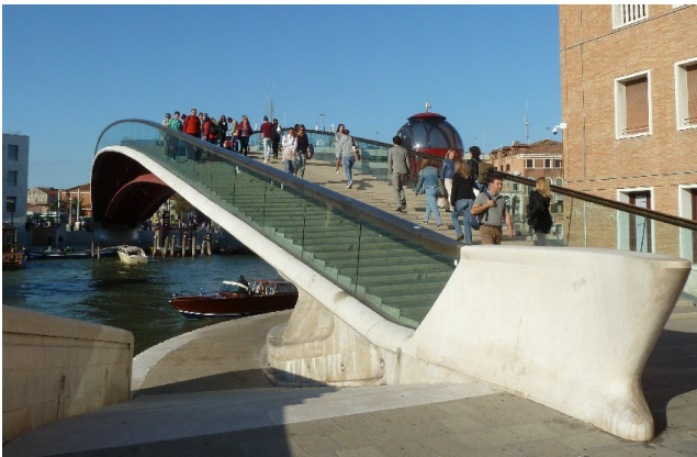
Fig. 3 - vista lato stazione 1