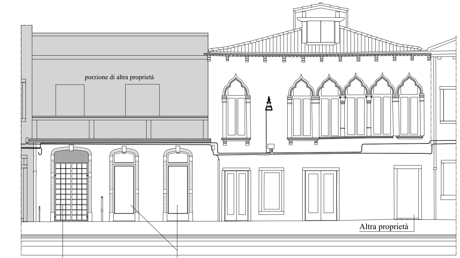
PROSPETTO FONDAMENTA NAVAGERO

Falda A mq 130,12 Lucernai mq 1,60 < (mq 130,12 x 2%) = mq 2,60