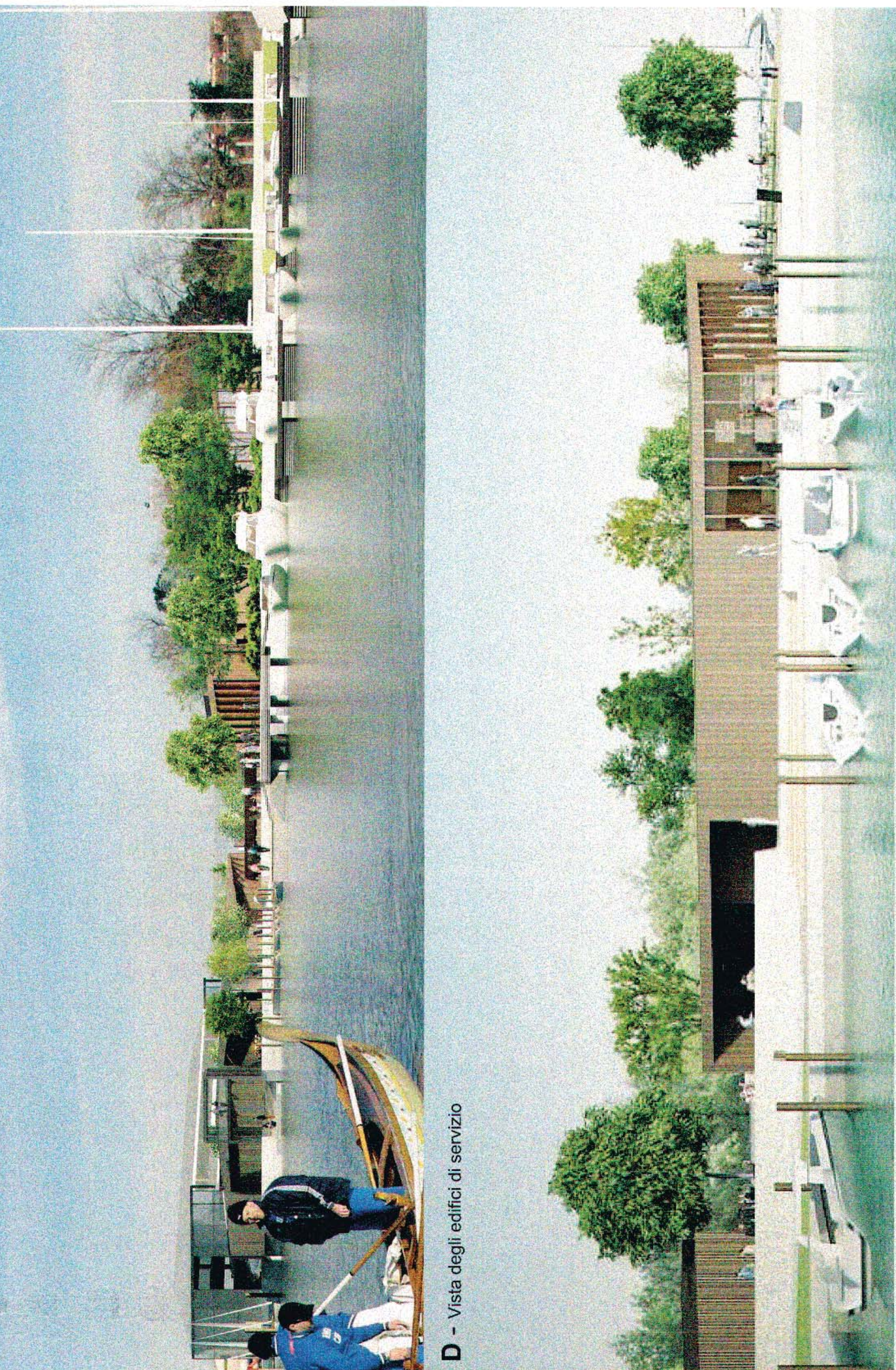
D - Vista degli edifici di servizio