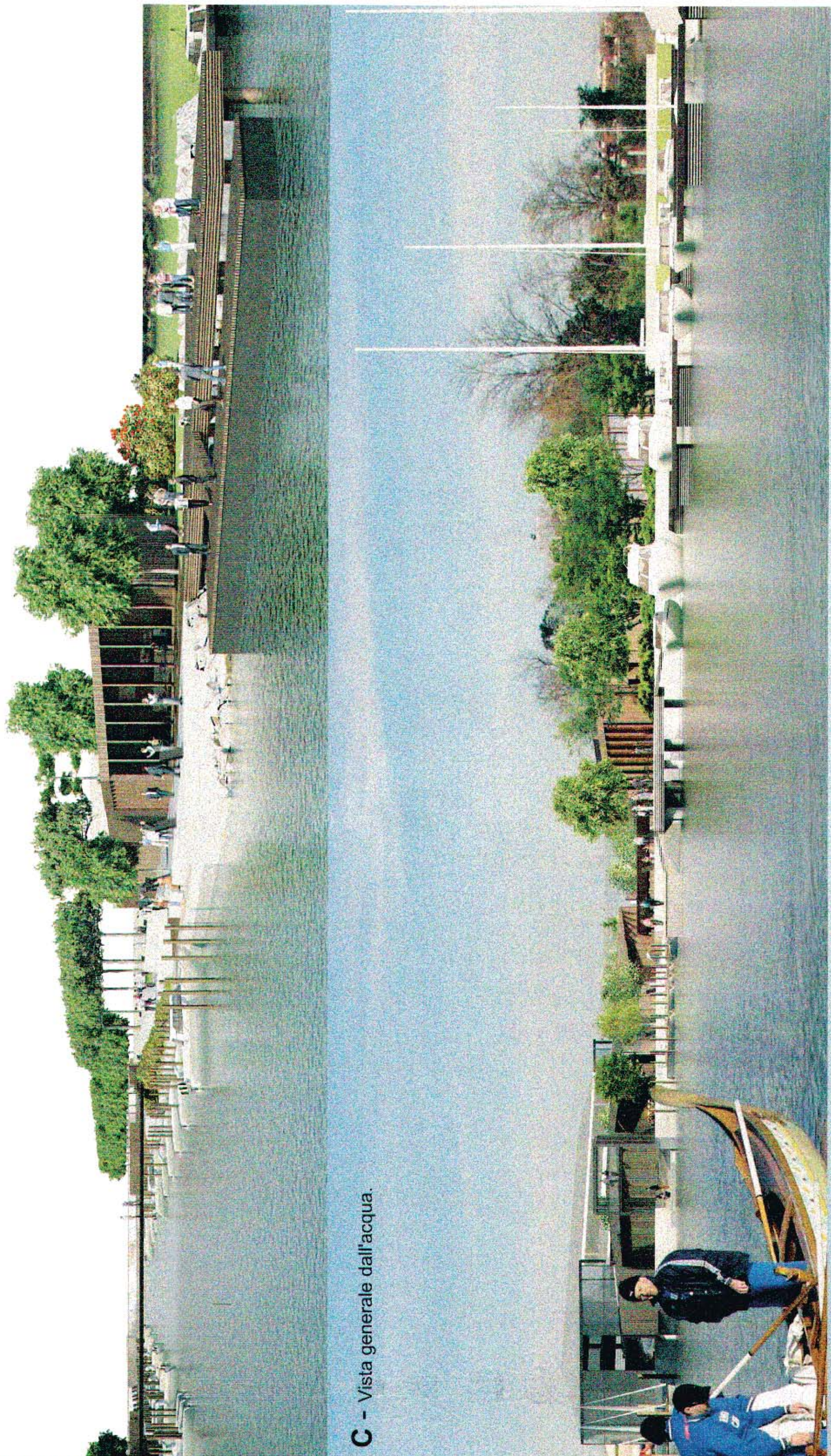
C - Vista generale dall'acqua.