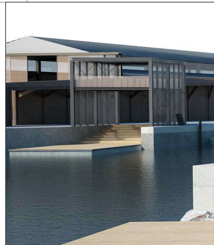
Vista del pontile dedicato all'alaggio delle canoe