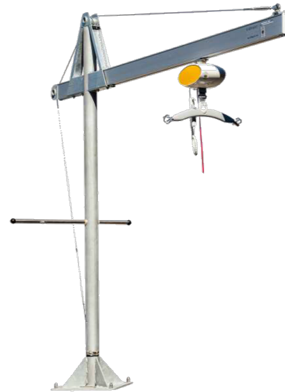
Esempio di sollevatore per utenti disabili per movimentazioni da e verso le imbarcazioni.