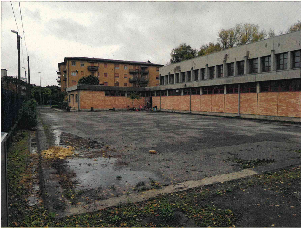
FOTO n.3_ Piazzale interno ove sarà realizzato l'ampliamento