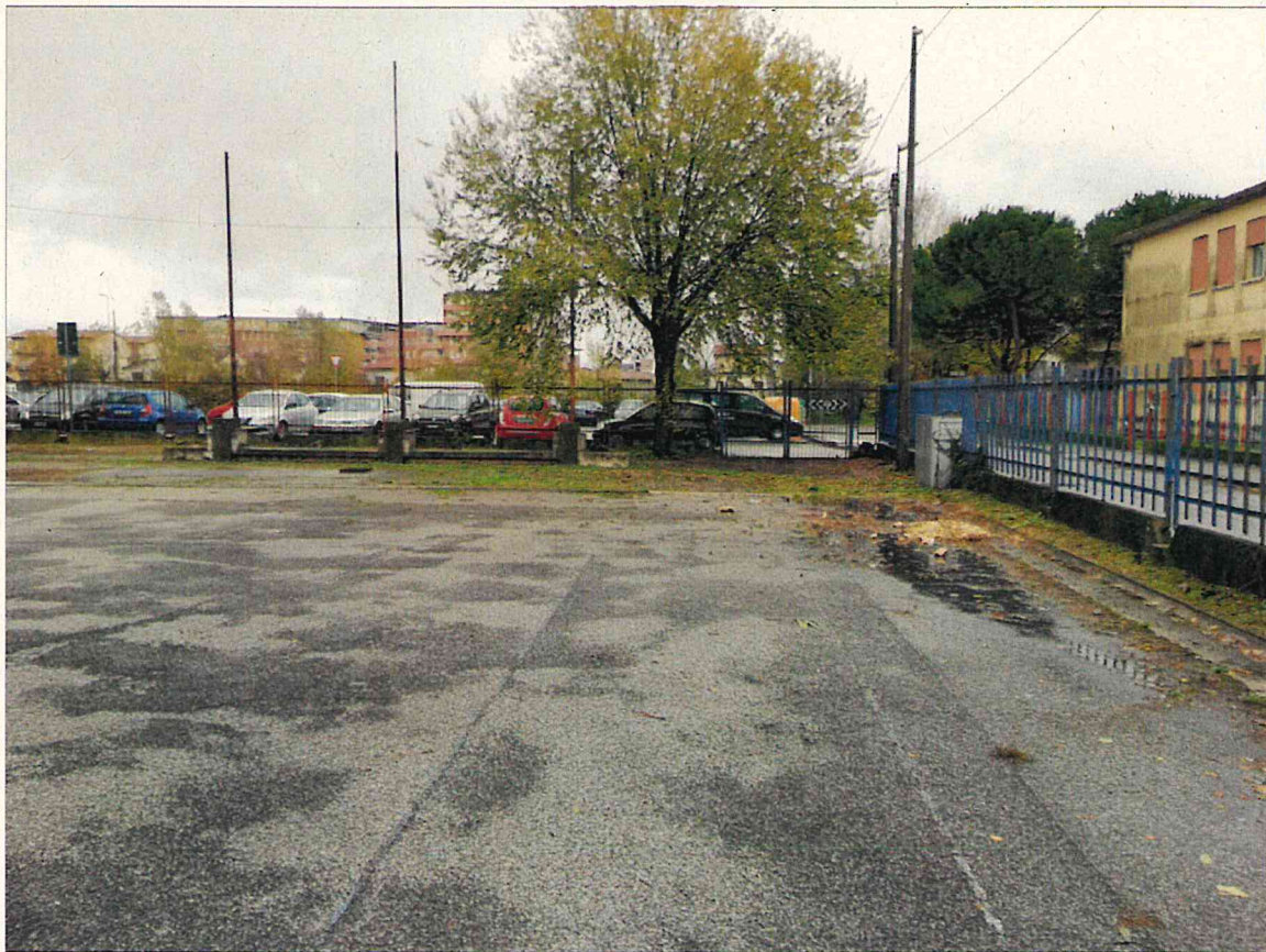
FOTO n. 4_ Piazzale interno ove sarà realizzato l'ampliamento