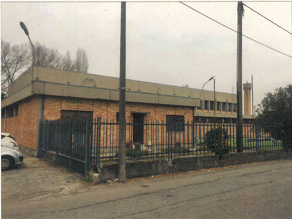
FOTO n.2_Incrocio con Via Cima D'Asta