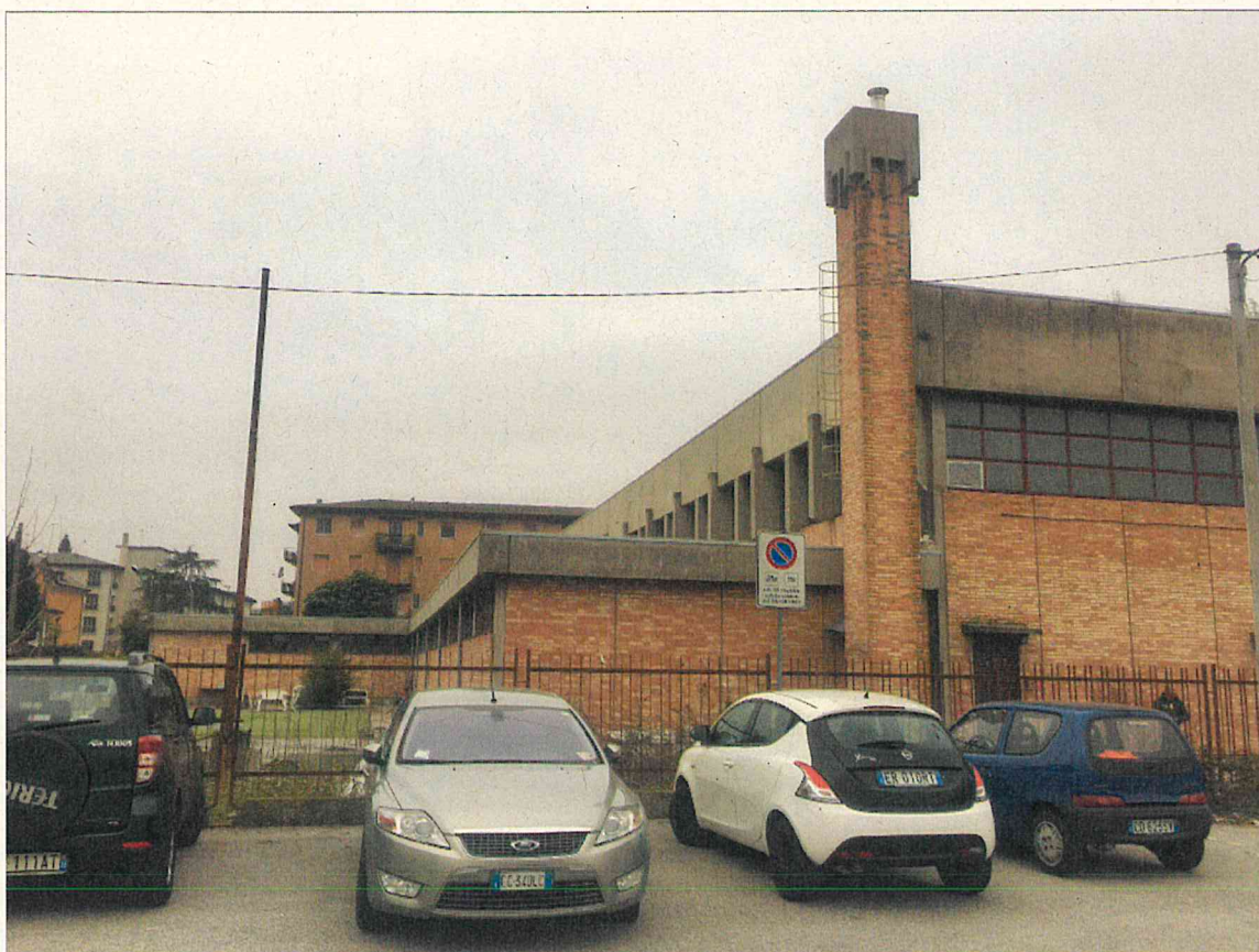
FOTO n. 6_ Vista esterna dal parcheggio spettatori