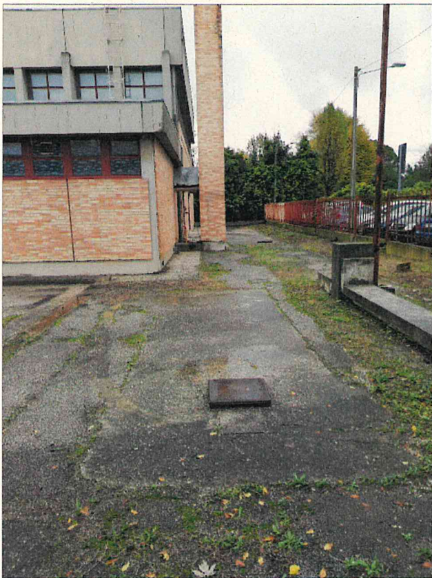
FOTO n.5 Retro palestra