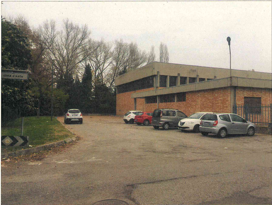
FOTO n.1_Ingresso principale impianto sportivo