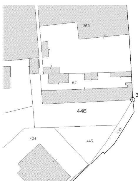
Estratto Mappa Scala 1:1000