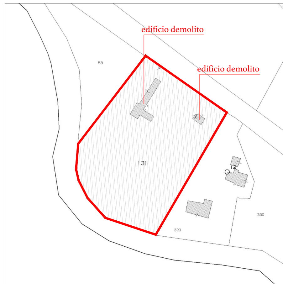
Estratto mappa _ scala 1:2000