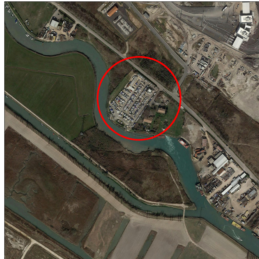
Inquadramento area _ scala 1:5000