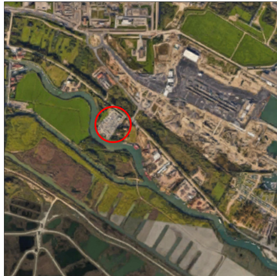
Inquadramento area _ scala 1:10000

Via Forte Marghera 17/c 30172 Venezia-Mestre t. 041975687 info@tag-architetti.com www.tag-architetti.com