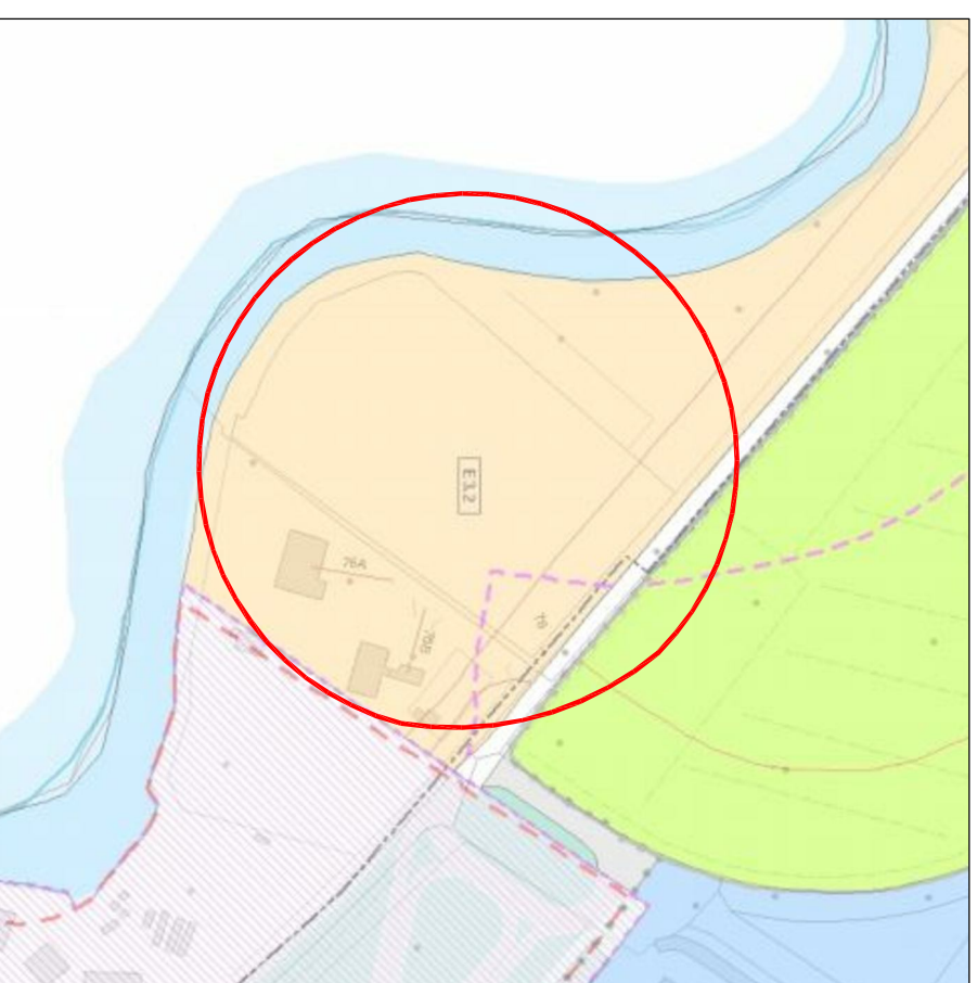
Estratto PRG stato attuale _ scala 1:2000