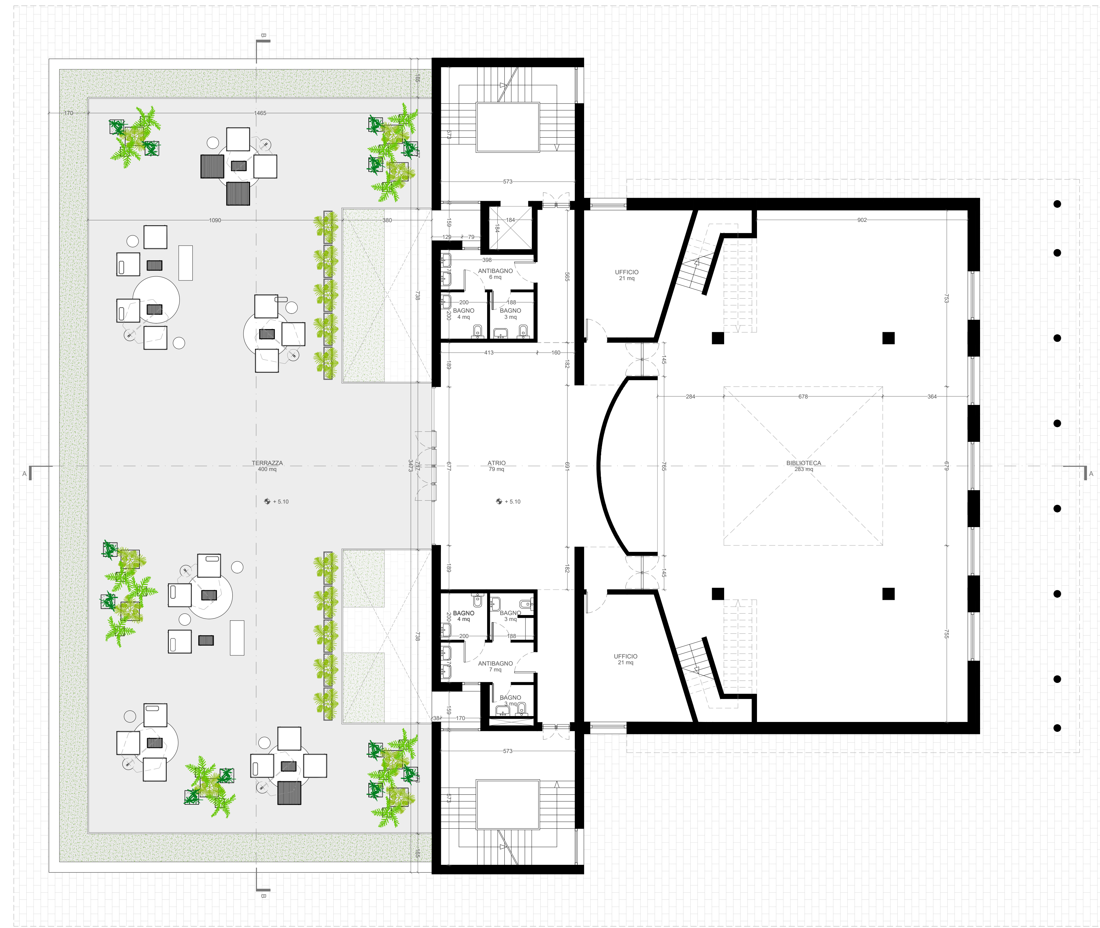
PIANTA PIANO PRIMO - Scala 1:100