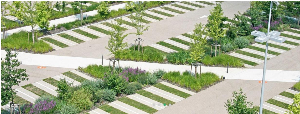
Figura 7 - Riferimenti parcheggi drenanti

Un'attenzione particolare sarà posta alla tutela degli insediamenti residenziali limitrofi con la creazione di fasce alberate di mitigazione ambientale e acustica. A servizio dell'insediamento e delle aree verdi saranno previsti adeguati spazi a parcheggio alberati, con posti auto realizzati con superfici drenanti.