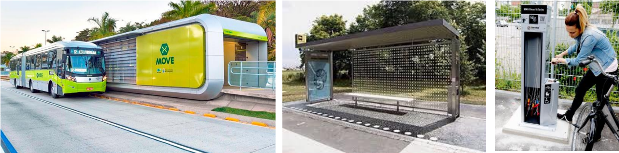
Figura 6 - Riferimenti fermata dell'autobus

All'interno del parco logistico sarà prevista la realizzazione di una fermata dell'autobus di cui potranno servirsi i dipendenti del parco logistico e gli abitanti dei quartieri limitrofi. Nell'area della fermata del trasporto pubblico sarà prevista una pensilina per il parcheggio delle bici, incentivando la mobilità dolce. Al sistema della mobilità si ricollegano i percorsi pedonali che collegano le aree verdi attrezzate di uso pubblico presenti nell'area.