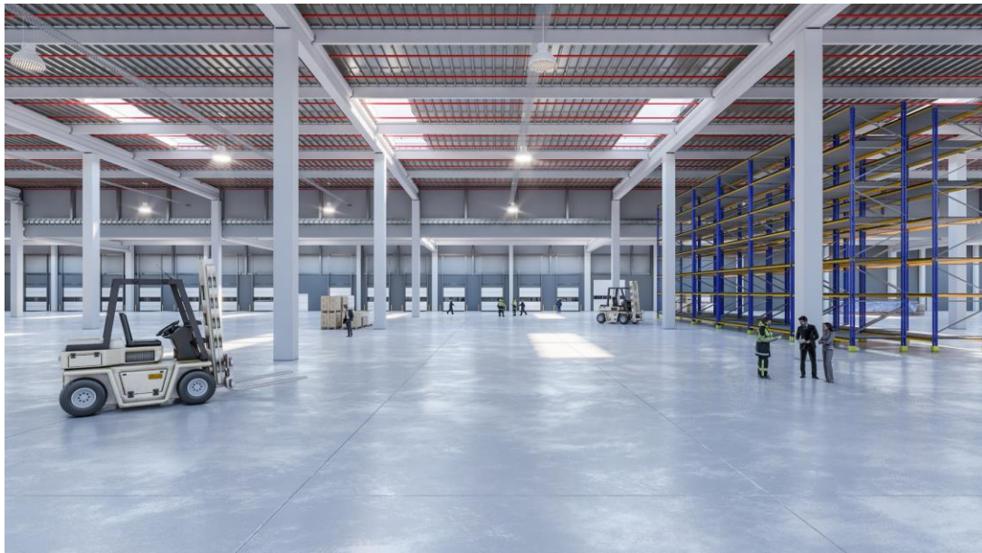
Figura 9 - Vista generica dell'interno deposito