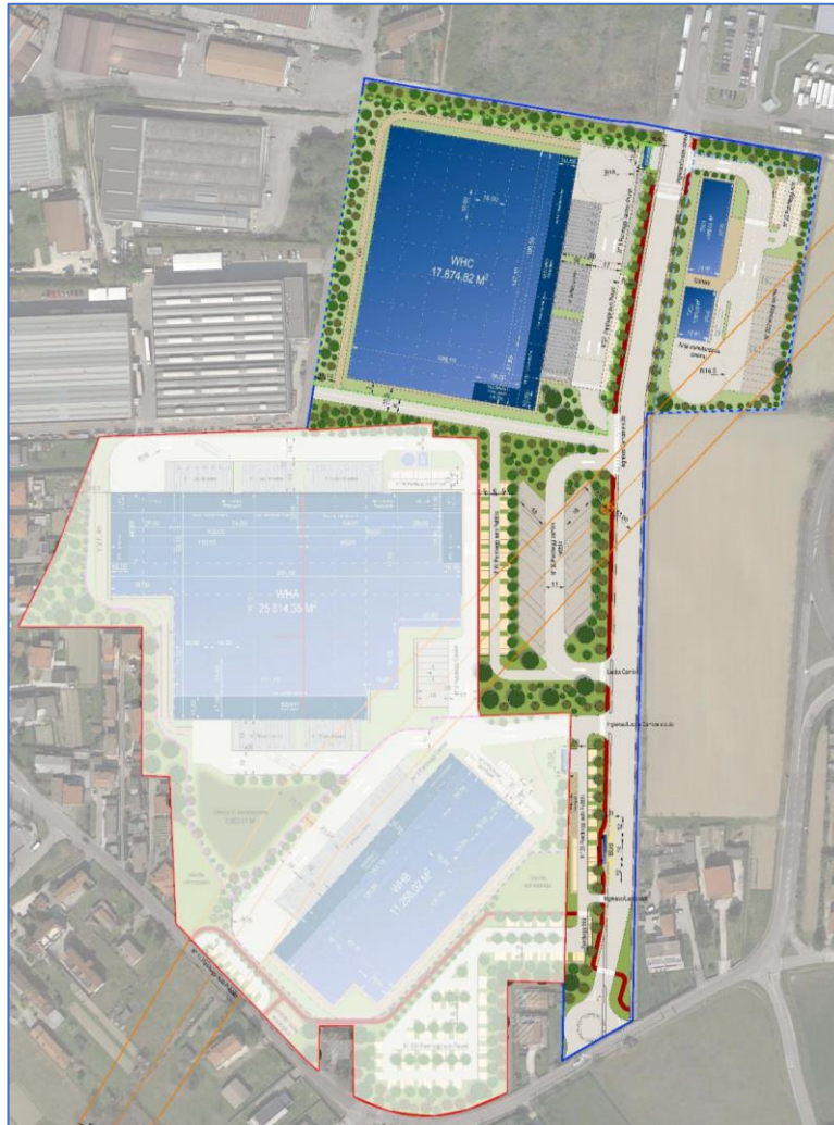
Figura 3 - Masterplan descrittivo

Il nuovo parco logistico di Dese sarà progettato come flessibile e funzionale, con attenzione alla sostenibilità e all'efficienza energetica dell'intero complesso, adattando perfettamente questi temi alle esigenze logistiche.