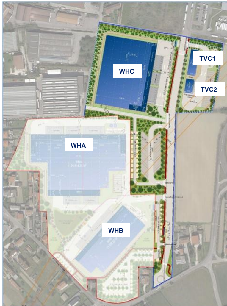
Figura 8 - Indicazione degli immobili