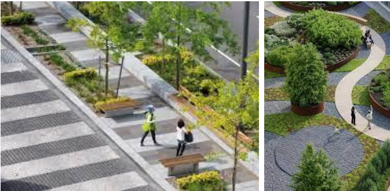
Figura 5 - Riferimenti di spazi pubblici

L'accessibilità e fruibilità degli spazi esterni contribuisce notevolmente al benessere dei lavoratori, per questo il progetto degli spazi aperti del Parco realizzerà un sistema di spazi verdi e percorsi tali da compensare l'attività umana svolta nell'area. Le aree esterne verranno attrezzate per consentirne la fruizione da parte dei dipendenti che lavorano all'interno del parco logistico. Verranno scelte specie arboree ed arbustive autoctone, che dopo un primo periodo di attecchimento, che ne richiederà la cura, non necessiteranno di particolare manutenzione, in termini di tempo e denaro.