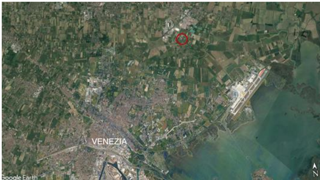
Figura 1 – Macro-inquadramento