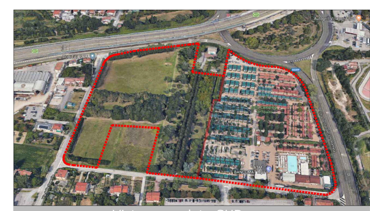
Vista aerea lato SUD