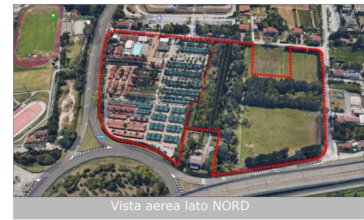
Vista aerea lato NORD