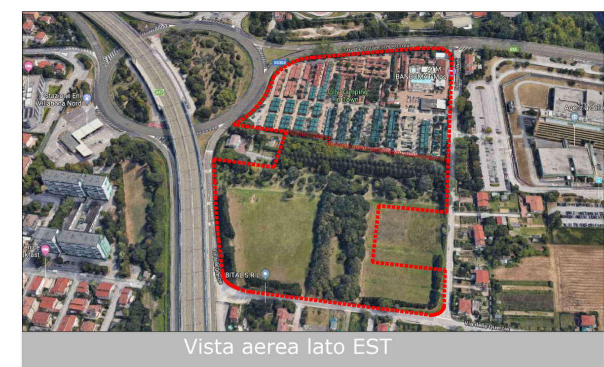
Vista aerea lato EST