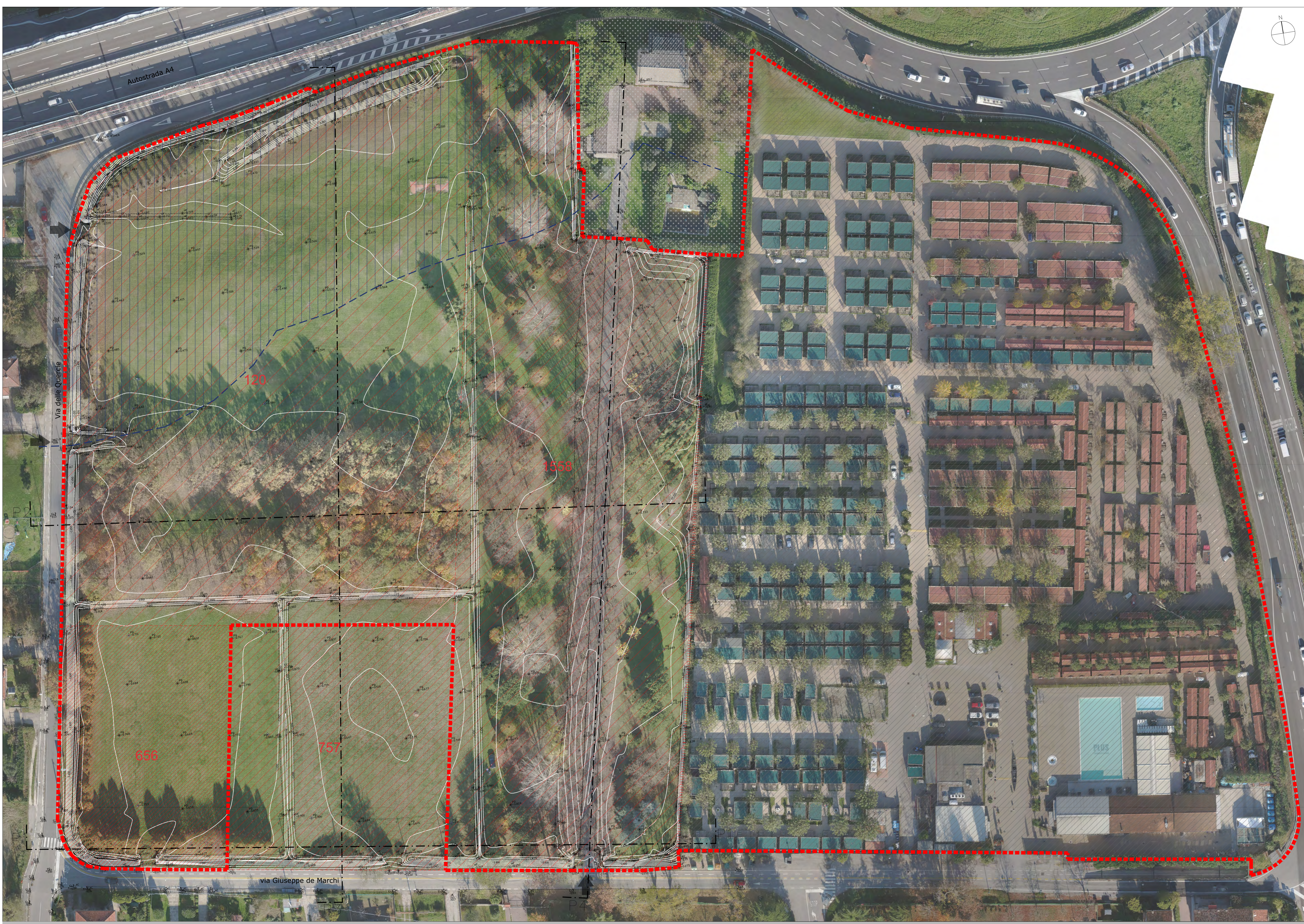
PLANIMETRIA STATO DEI LUOGHI AREA OGGETTO DI DOMANDA