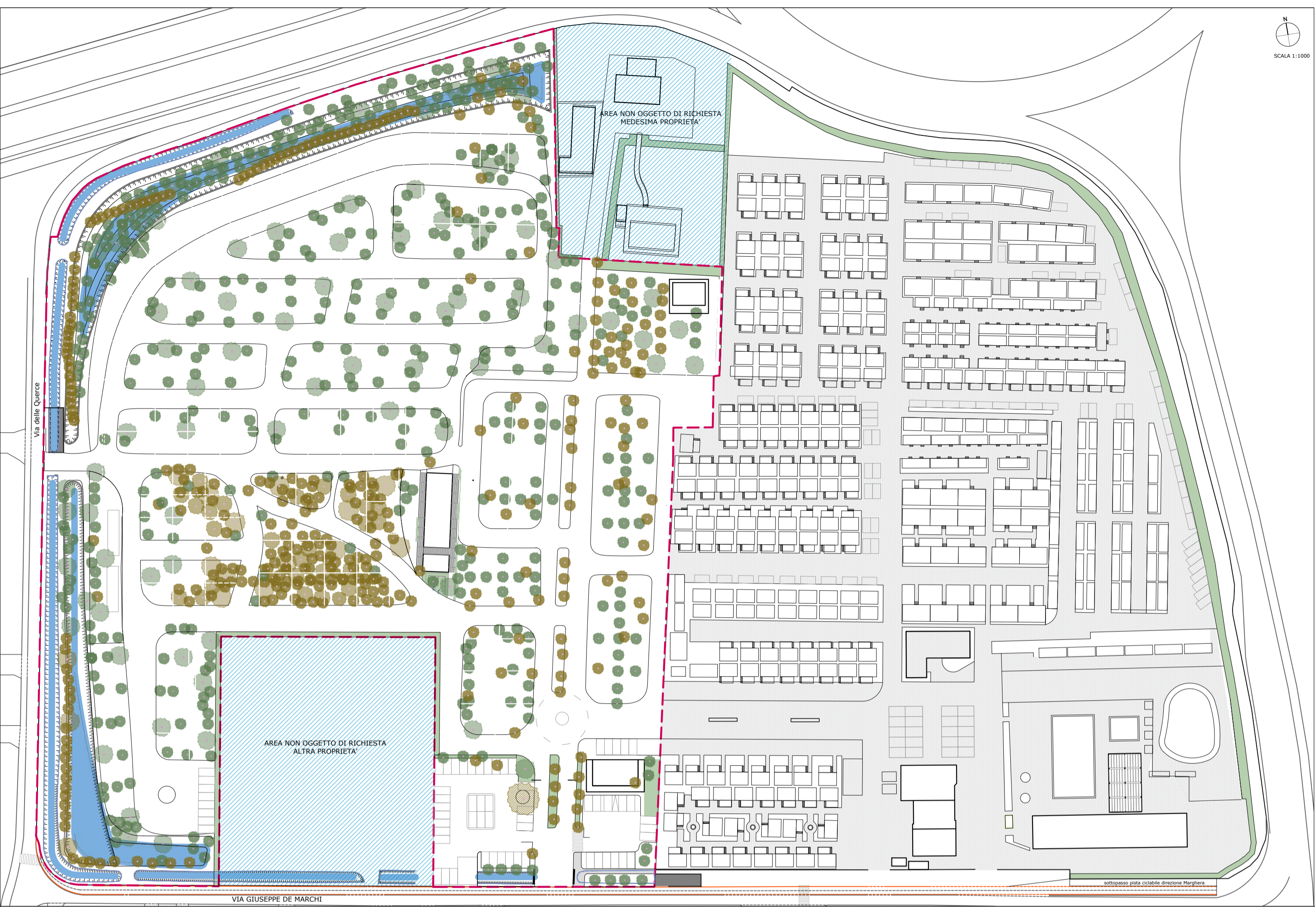
Planimetria aree verdi e predisposizione bacini di laminazione