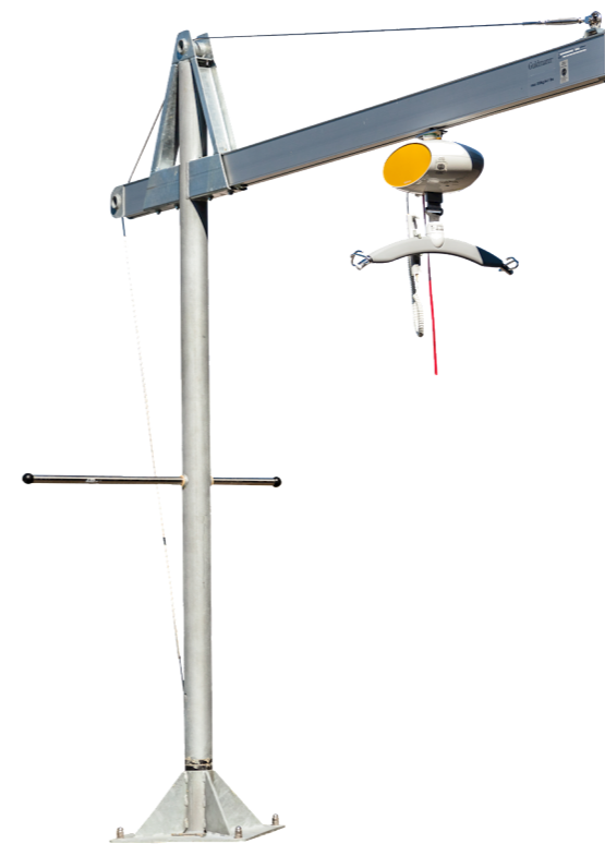
Esempio di sollevatore per utenti disabili per movimentazioni da e verso le imbarcazioni.