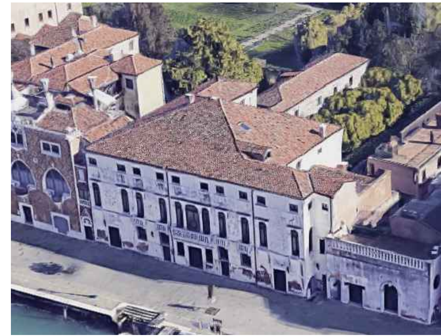
VILLA F Palazzo Volpi Minelli