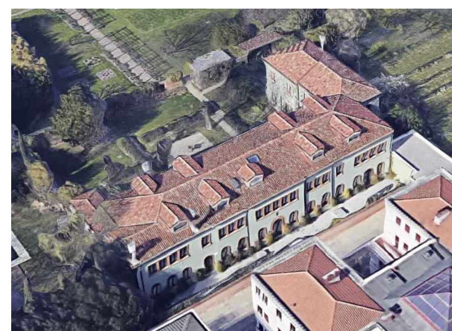
CONVENTINO Ex Asilo Mason