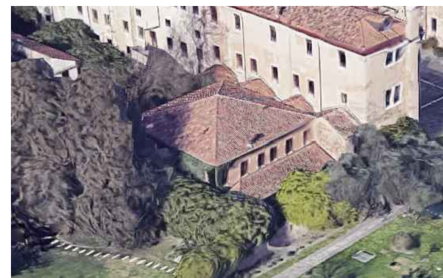
DOMUS Ex Ospizio Sagredo Diedo