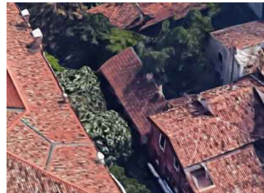
ANNEX Annesso Domus