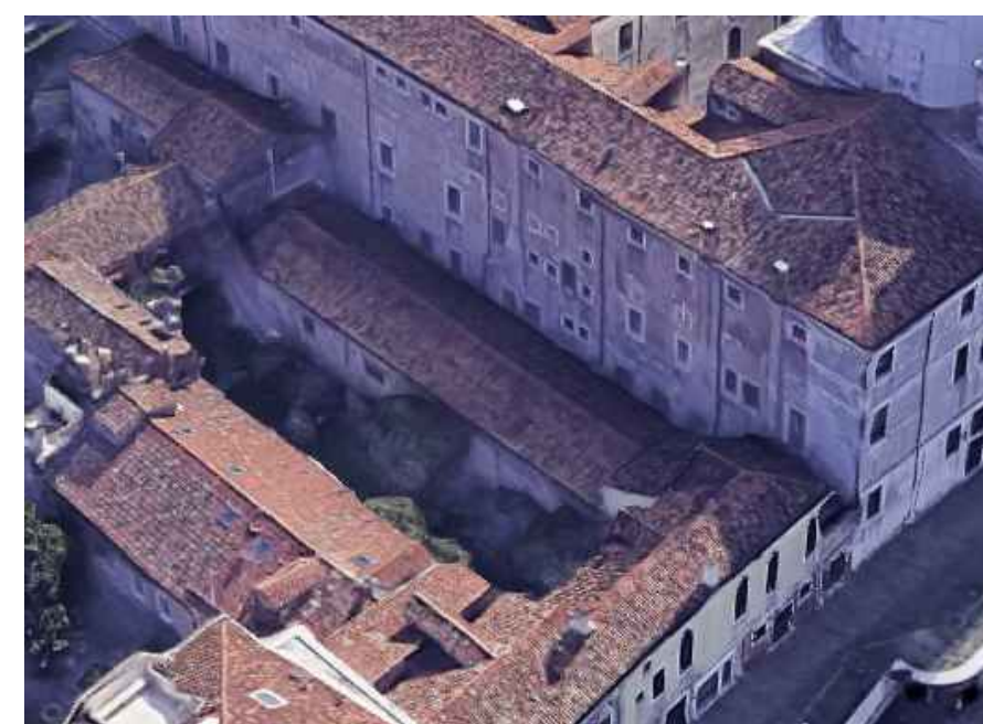
SP1 Ex magazzino SPA