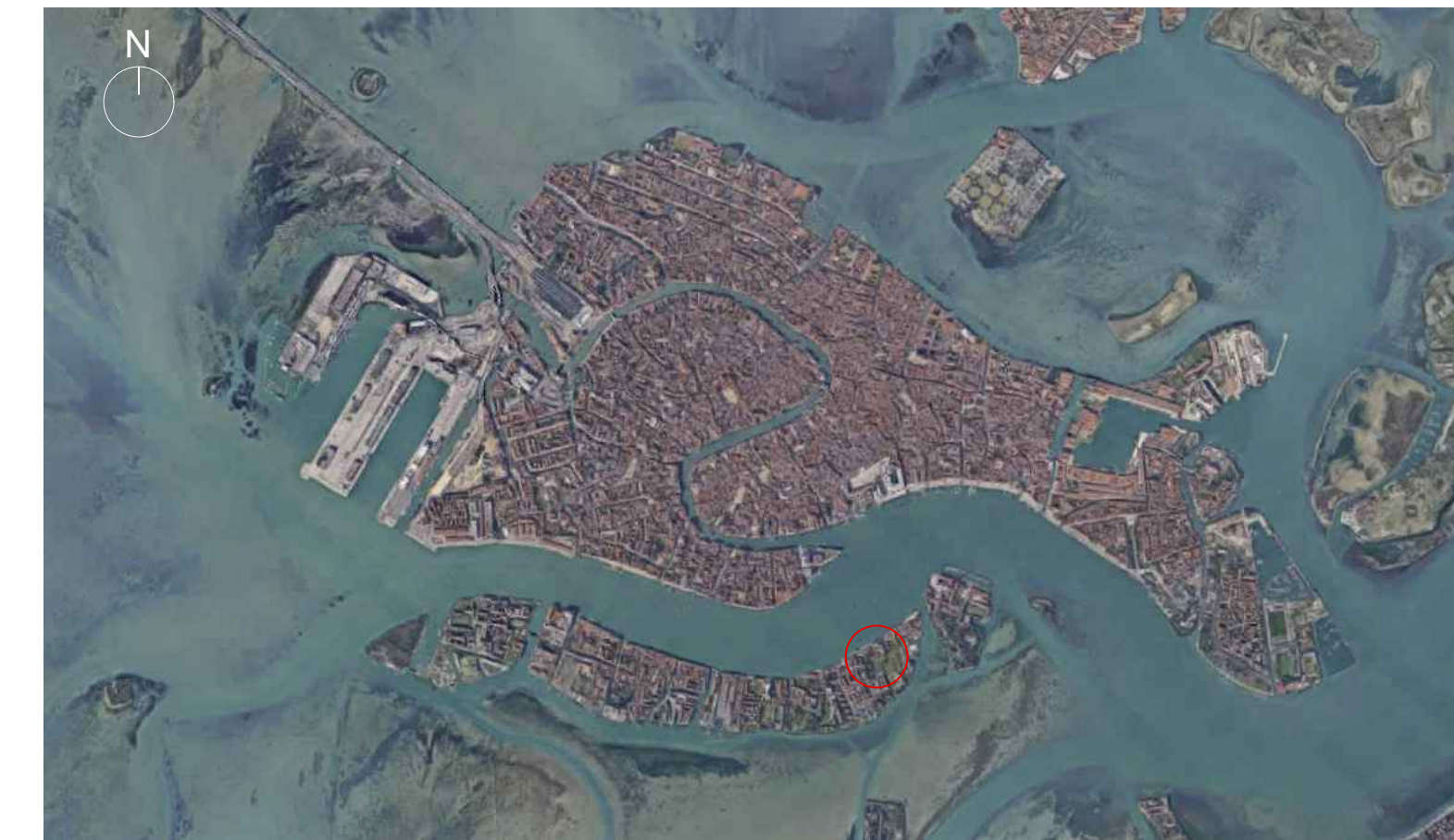
FOTOPIANO VENEZIA