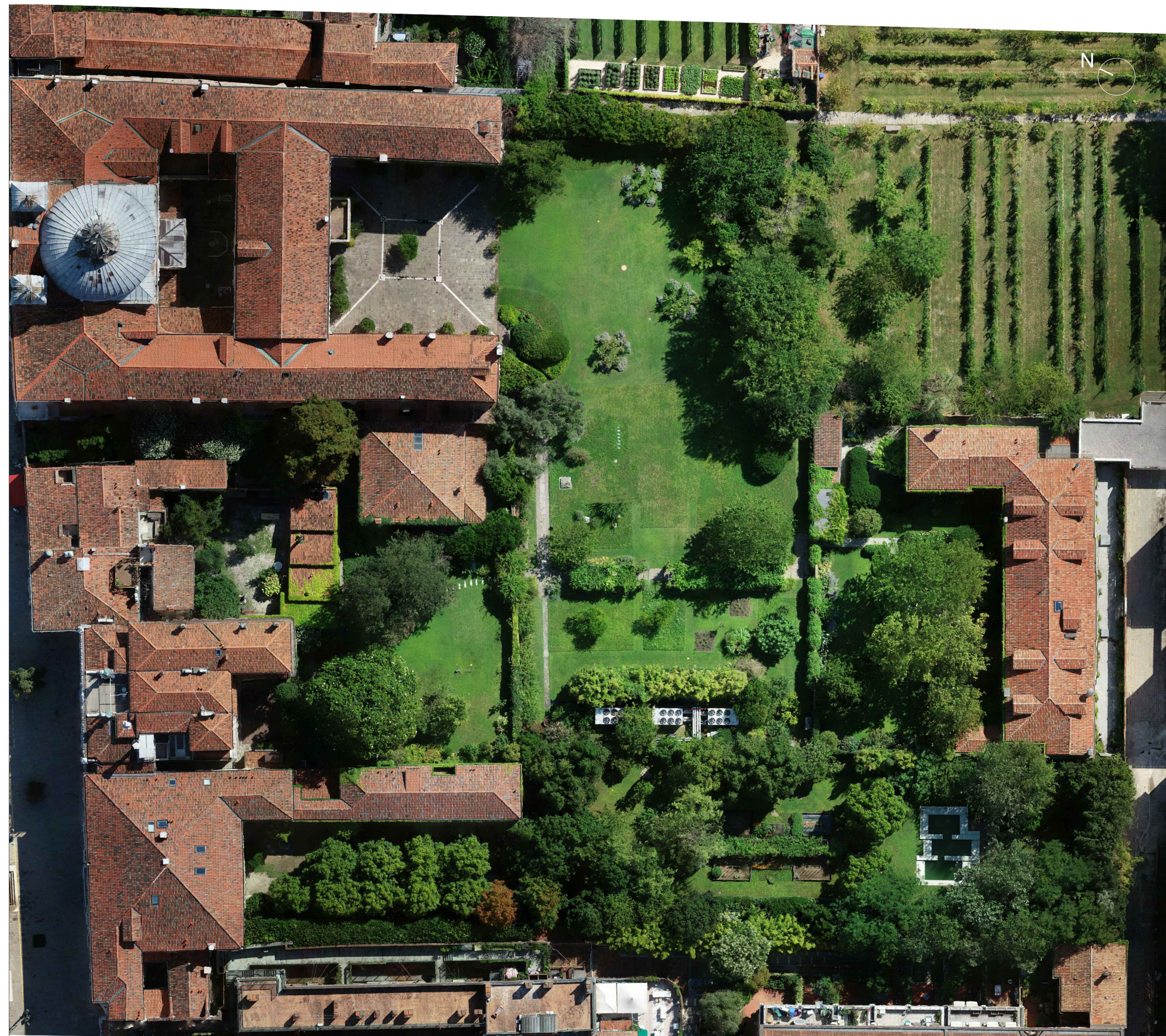
FOTOPIANO_STATO DI FATTO_scala 1:500