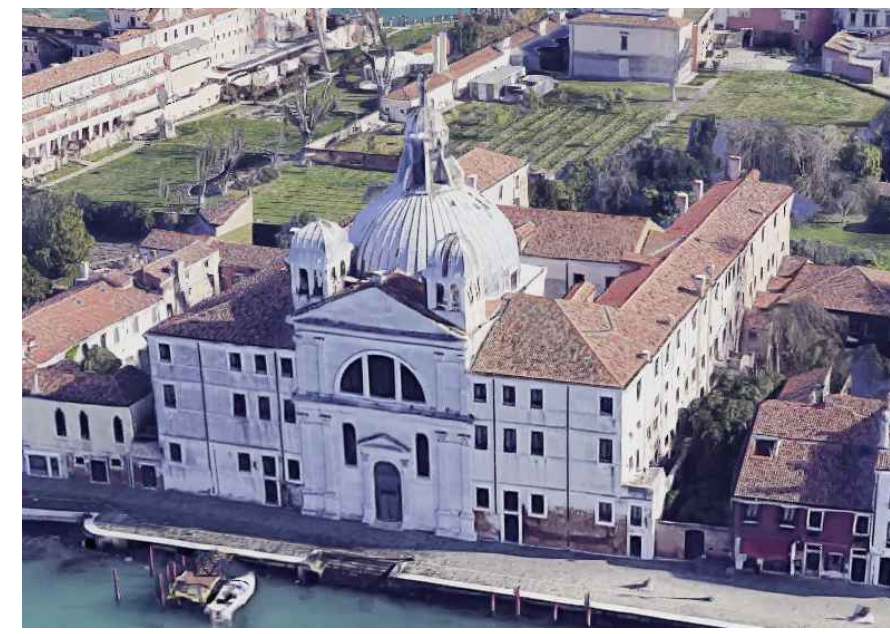
HOTEL PALLADIO Ex Convento delle Zitelle