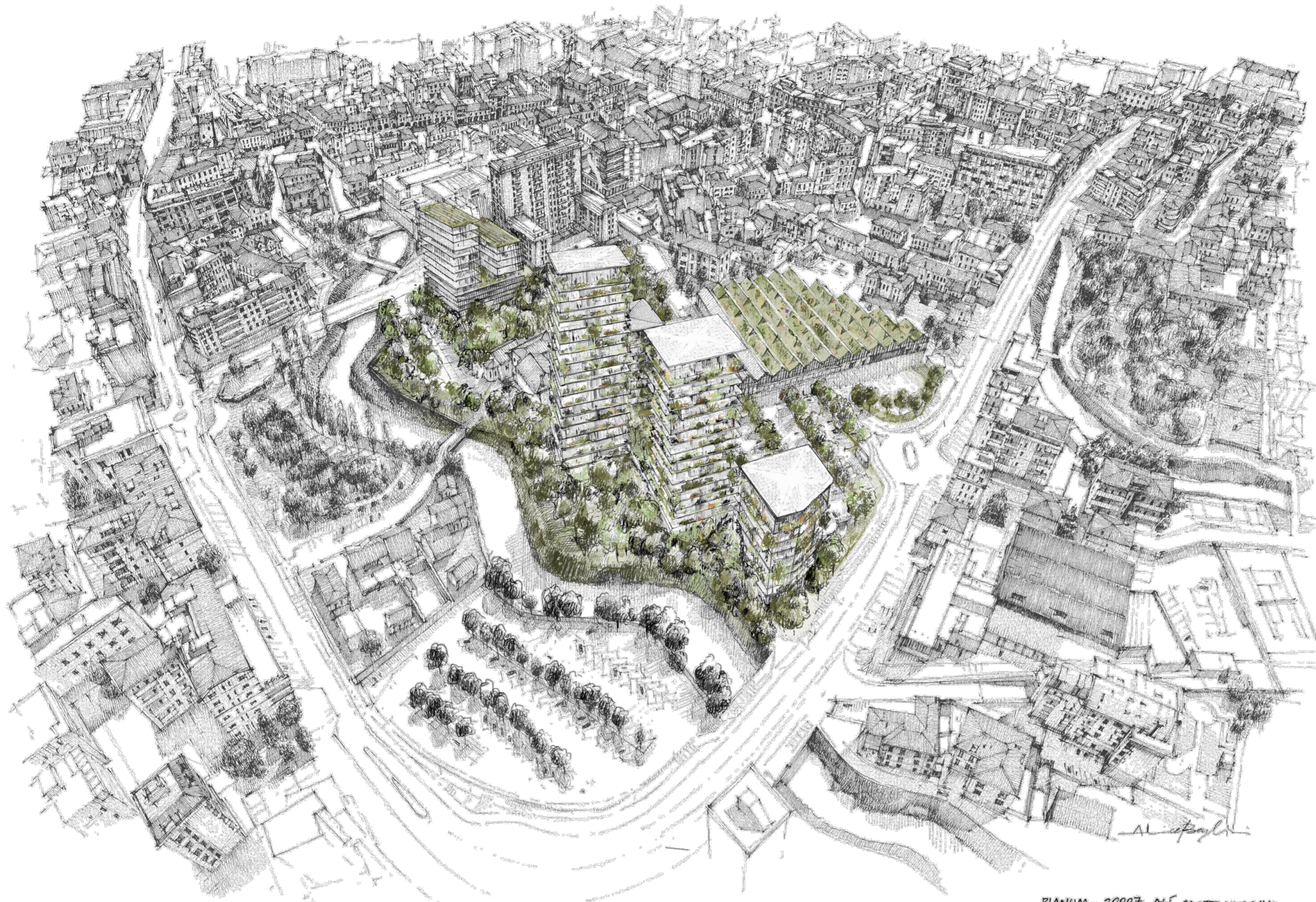
PLANUM - 2007 ALI CASTELVECCHIO