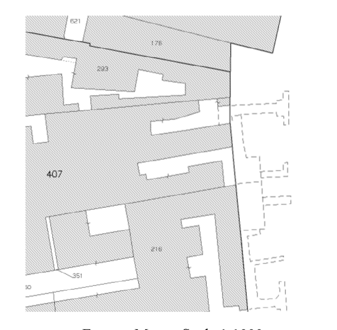
Estratto Mappa Scala 1:1000