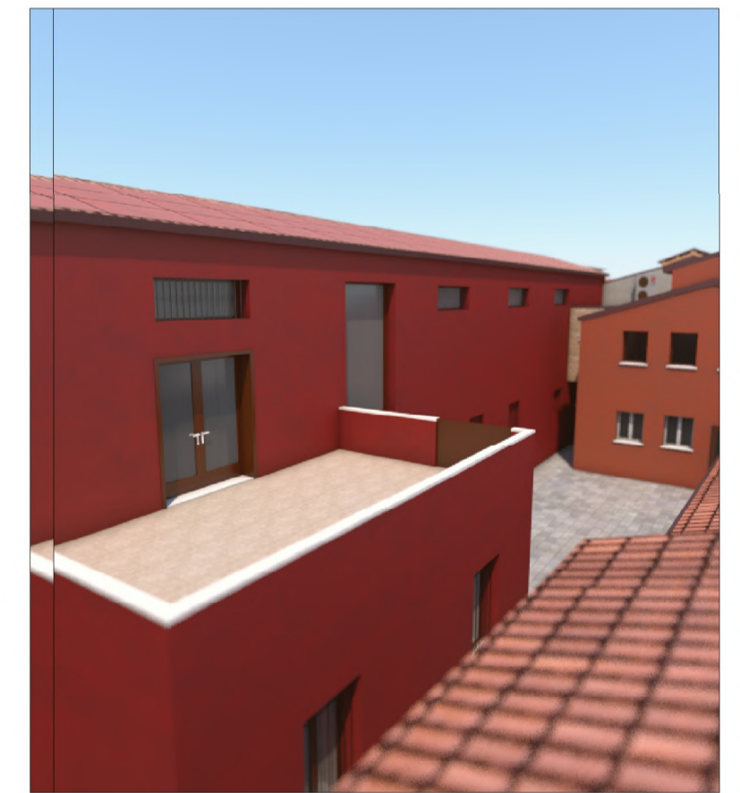
PROSPETTO SU SCOPERTO A