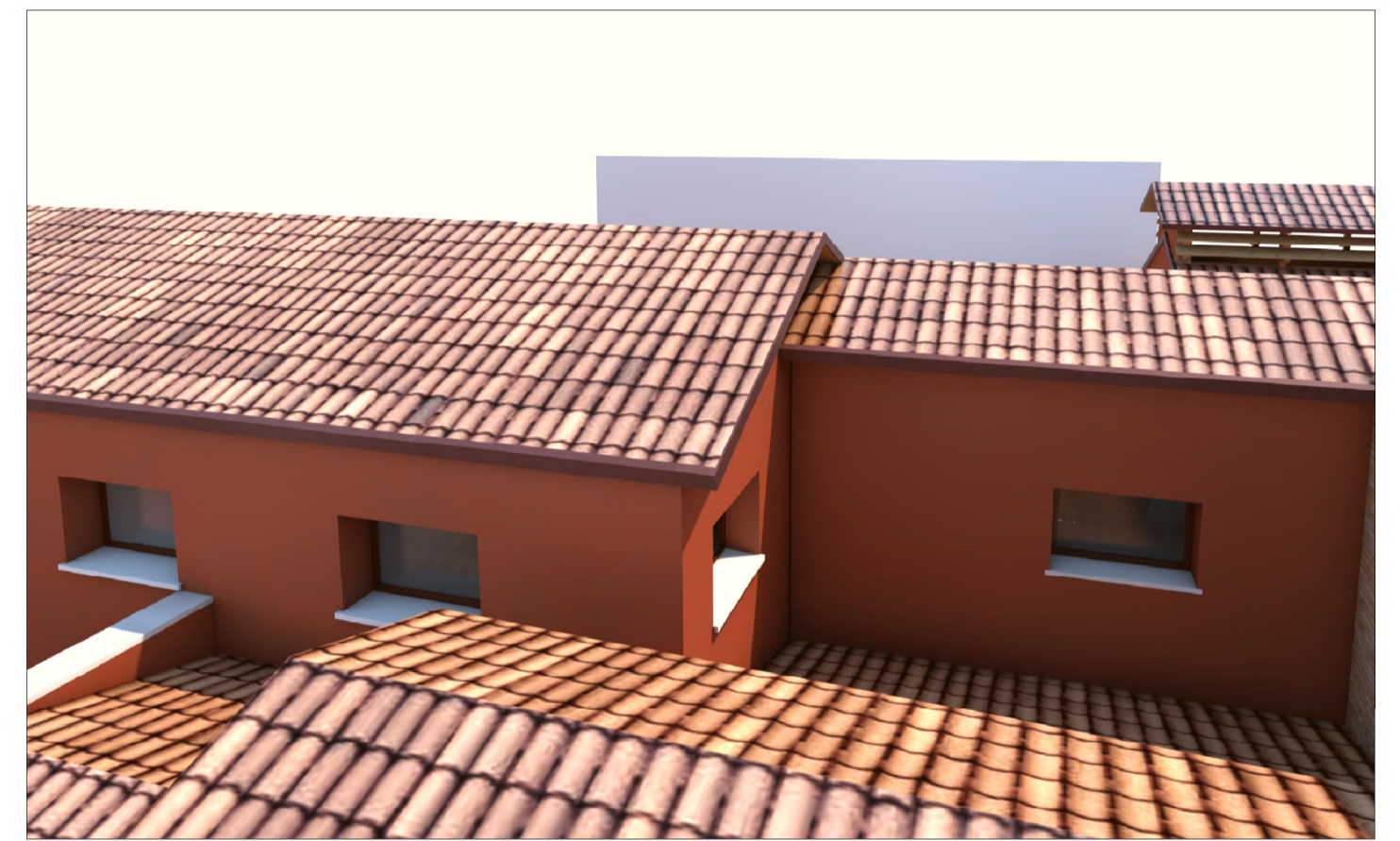
PROSPETTO NORD - CUCINA

Santa Croce 1711/1718 - 30135 - VENEZIA - Tel. 041/5223190 - email info@studiotecnicofurlan.it