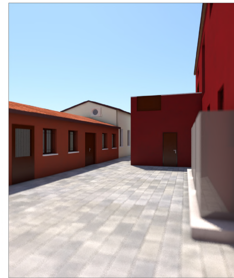
PROSPETTO SU SCOPERTO A