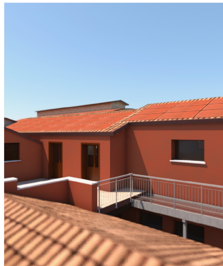
PROSPETTO SU TERRAZZA - B