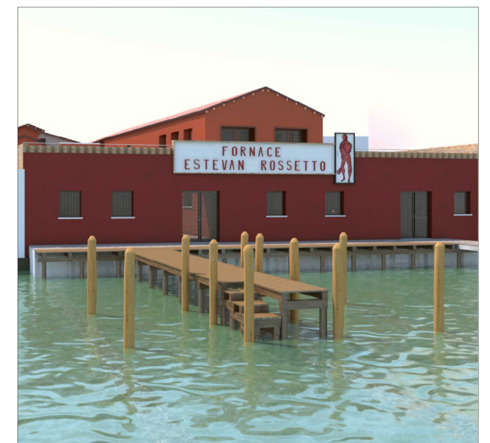
PROSPETTO SU CANALE ONDELLO