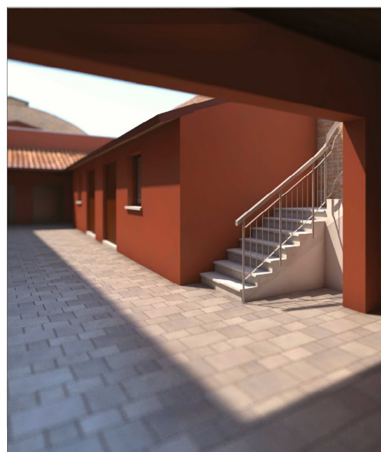
PROSPETTO SU SCOPERTO B