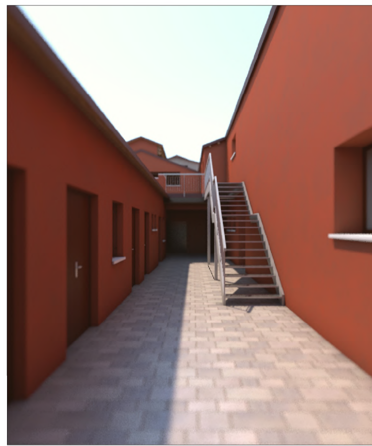
PROSPETTO SU SCOPERTO C