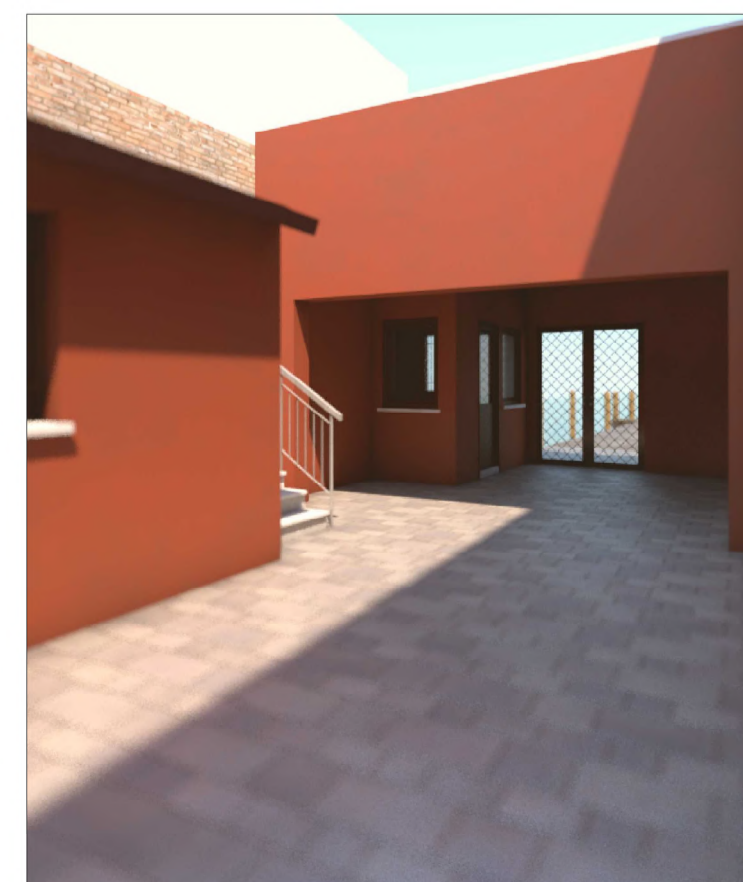
PROSPETTO SU SCOPERTO B