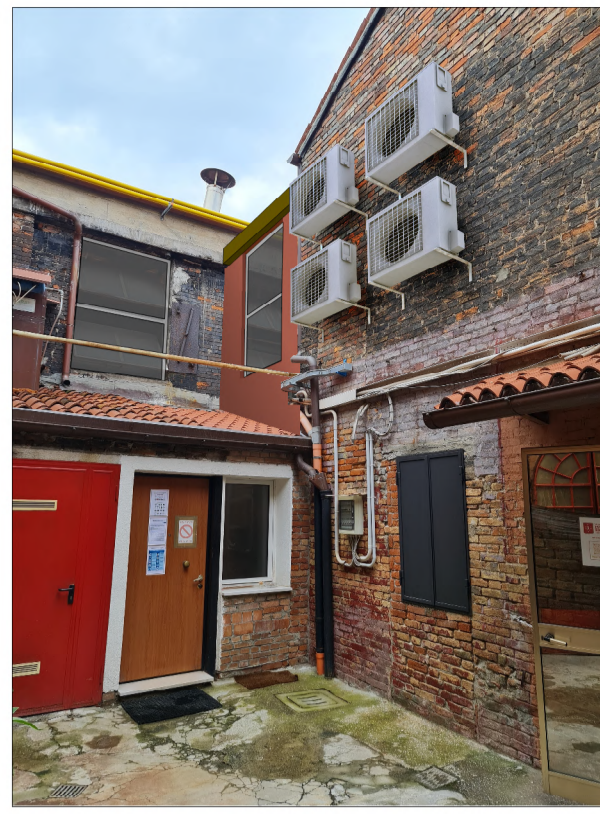
PROSPETTO SU SCOPERTO D