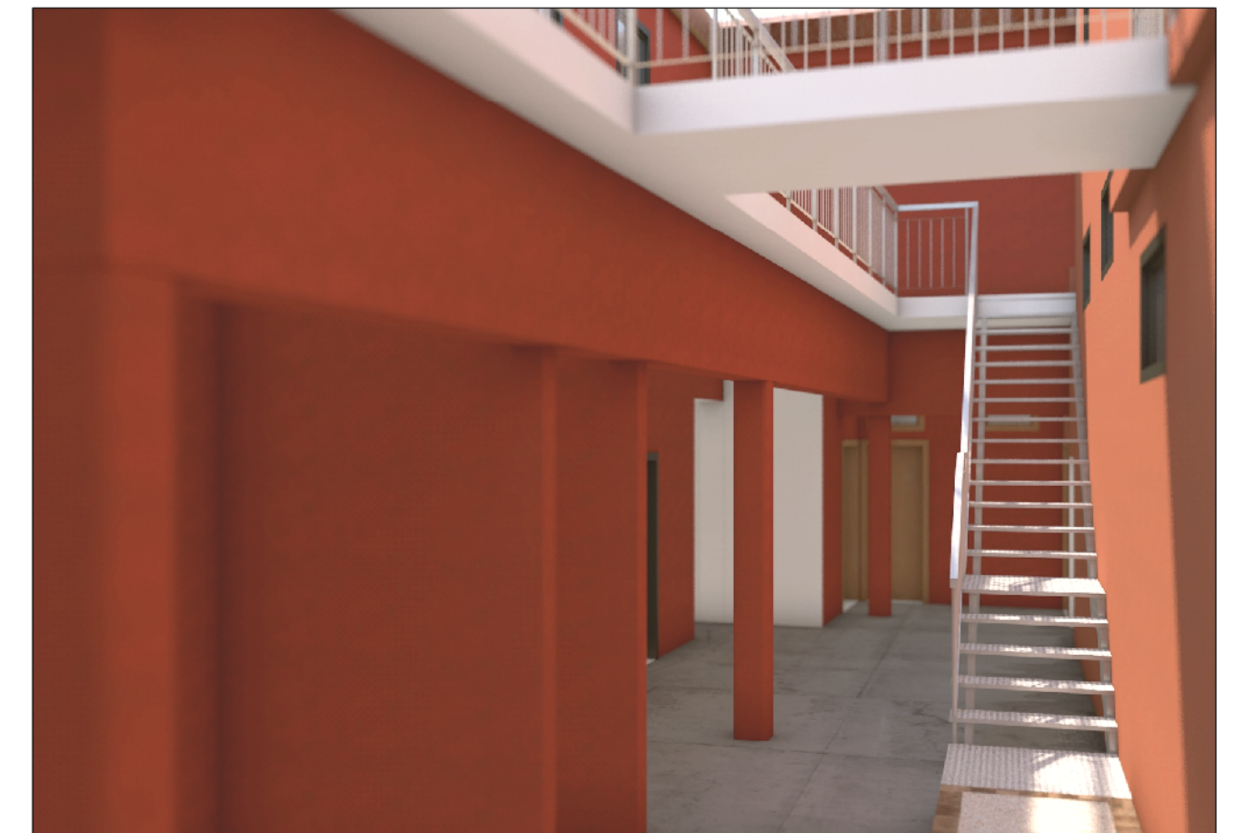
VISTA SU SCOPERTO