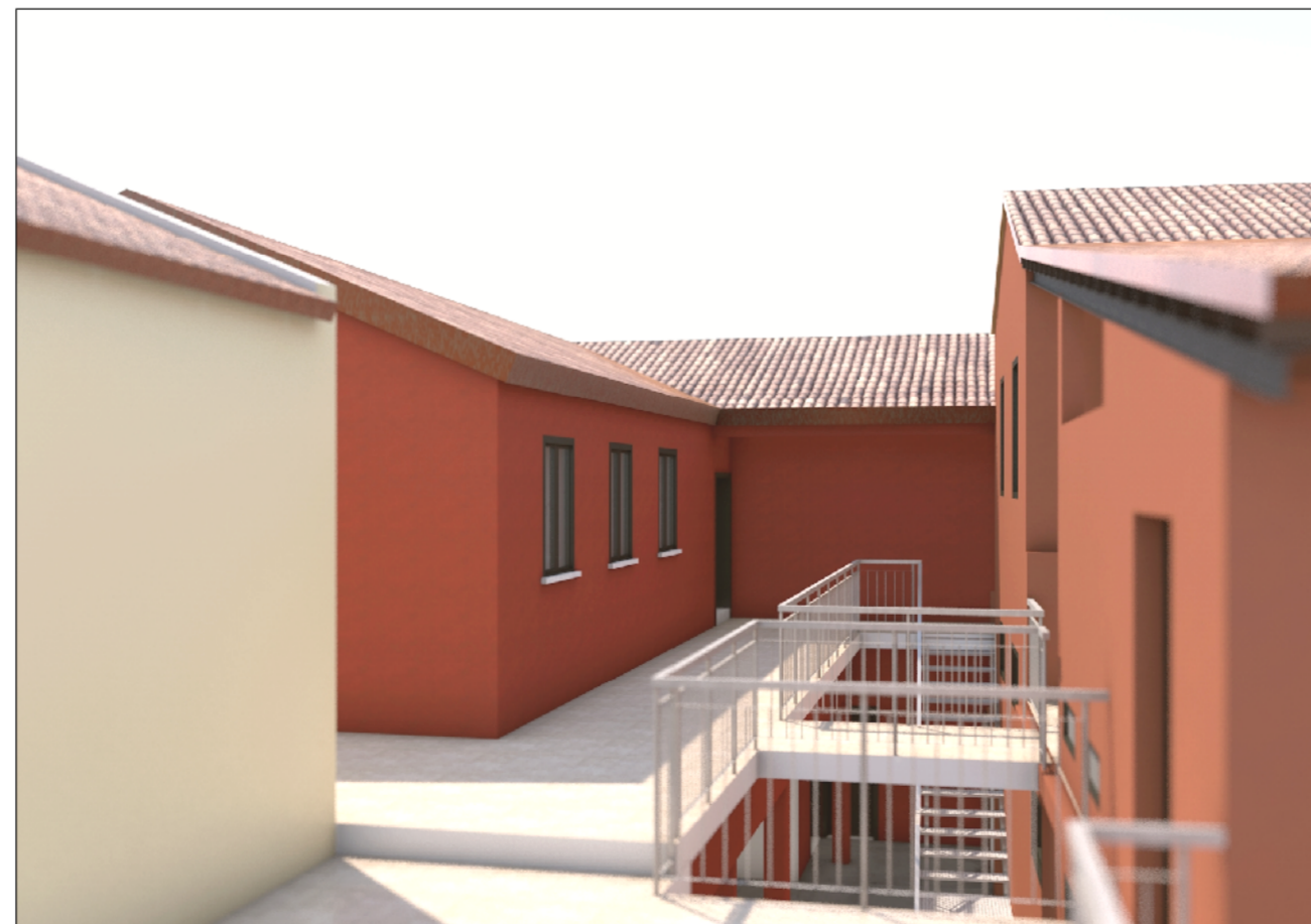
VISTA DA TERRAZZA - B