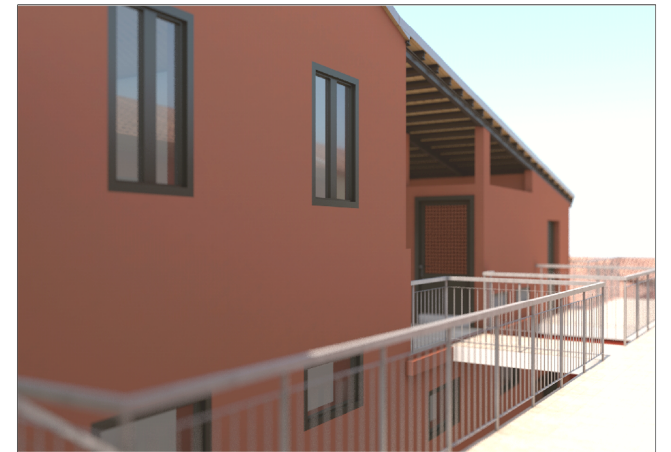
VISTA DA TERRAZZA - A