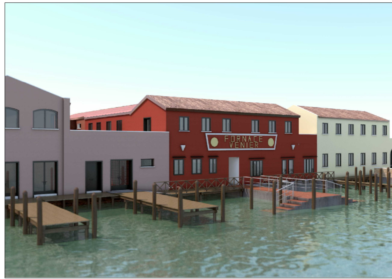
VISTA DA CANALE ONDELLO