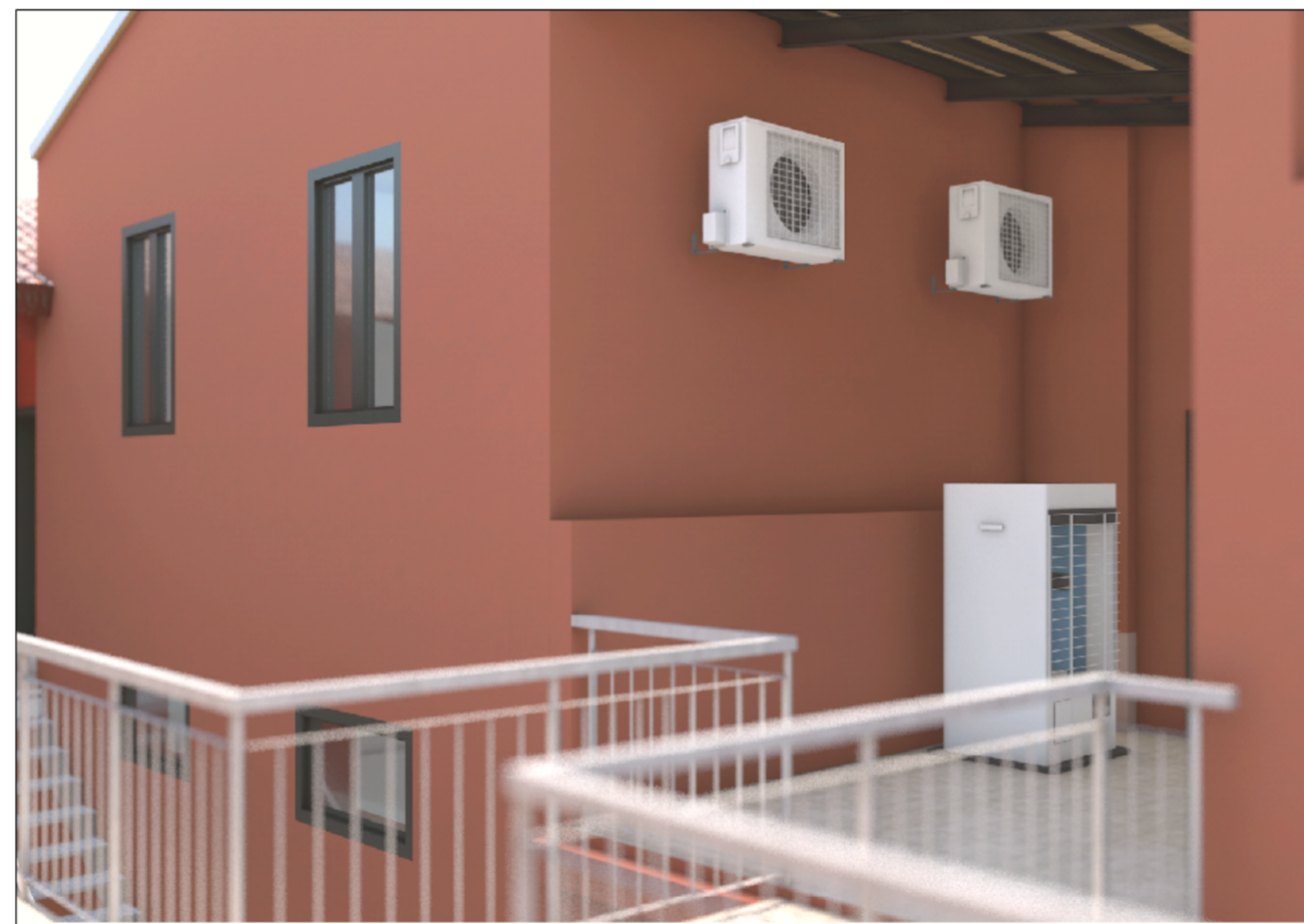
VISTA DA TERRAZZA - A