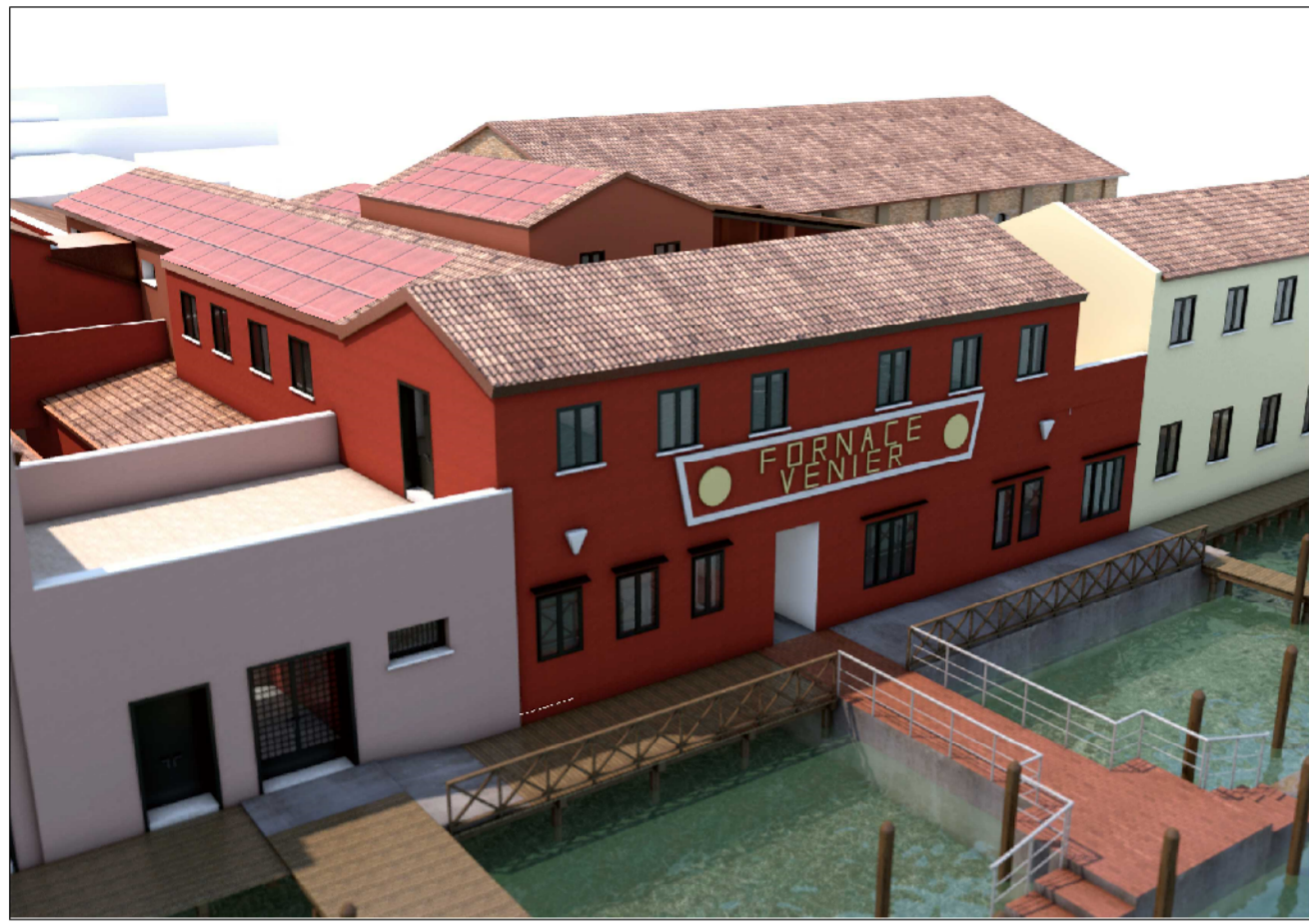
VISTA DA CANALE ONDELLO